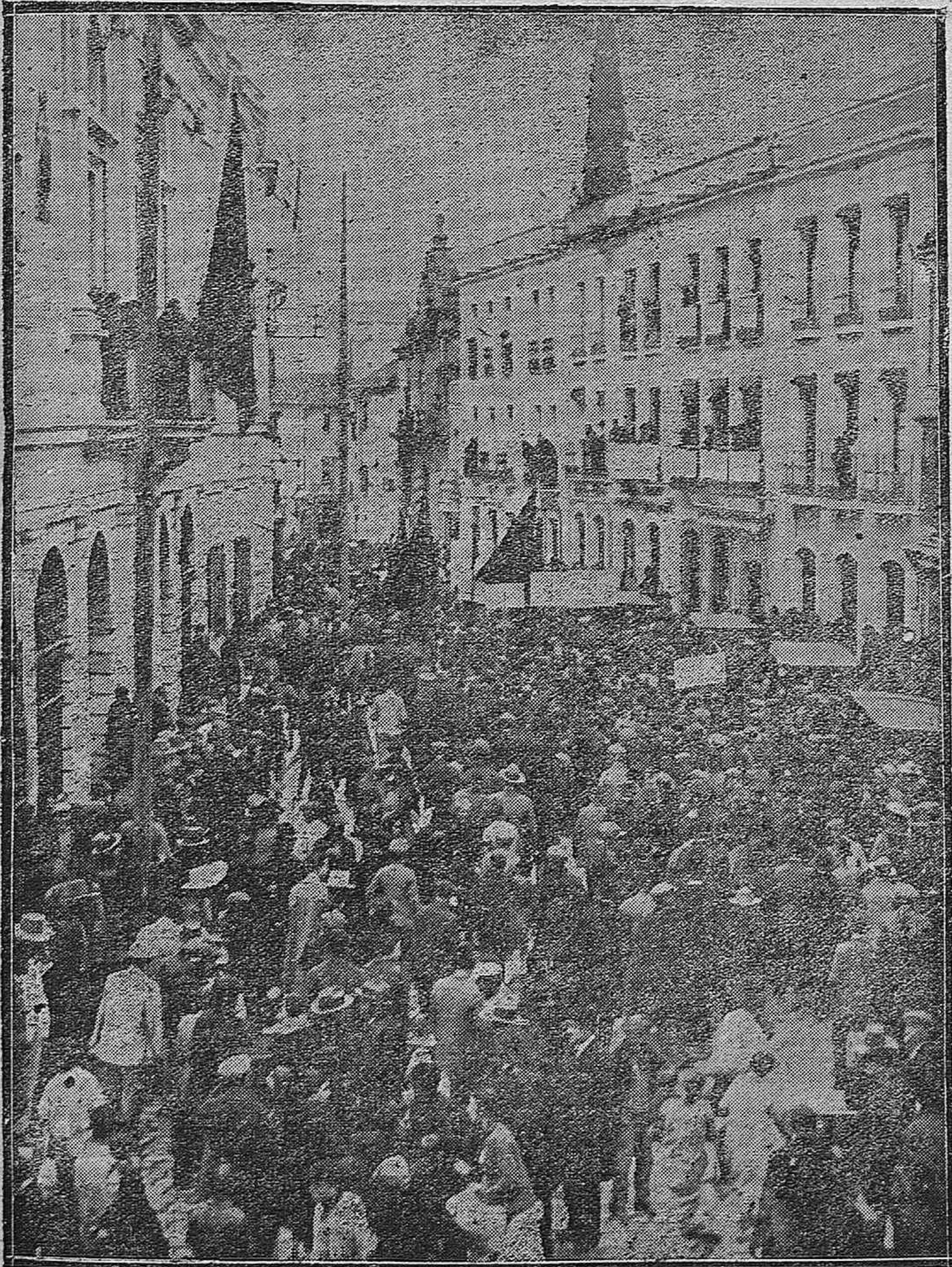
La manifestación escolar que esta mañana ha tributado un homenaje a los aviadores que han coronado el raid a la Argentina.