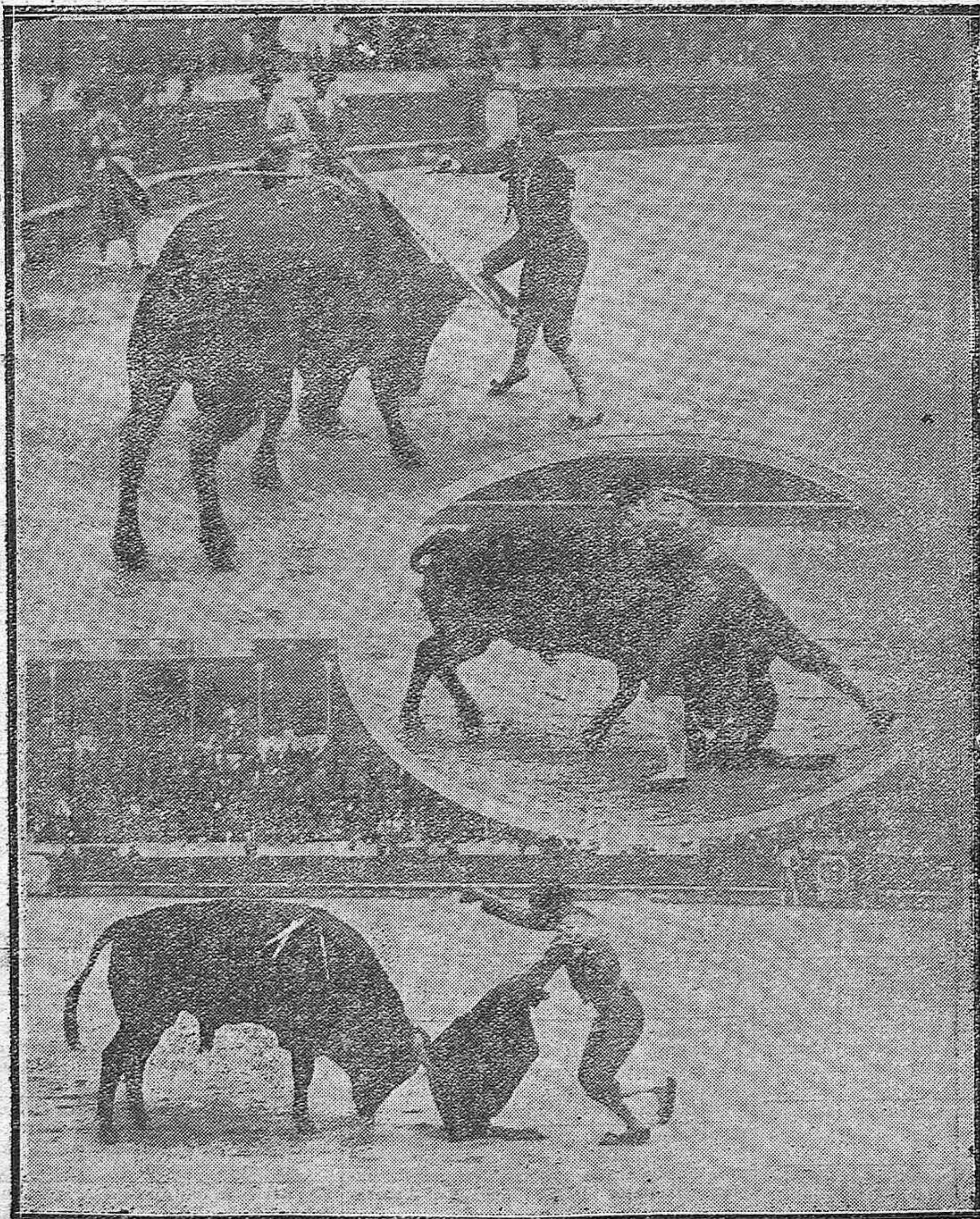
LA NOVILLADA DEL DOMINGO.-Nuestro palsano Cantimplas en el toro de la oreja.-Estanillo de Triana en el soberbio estoconazo al quinto toro.-Angelillo, imitando a Chicuelo.