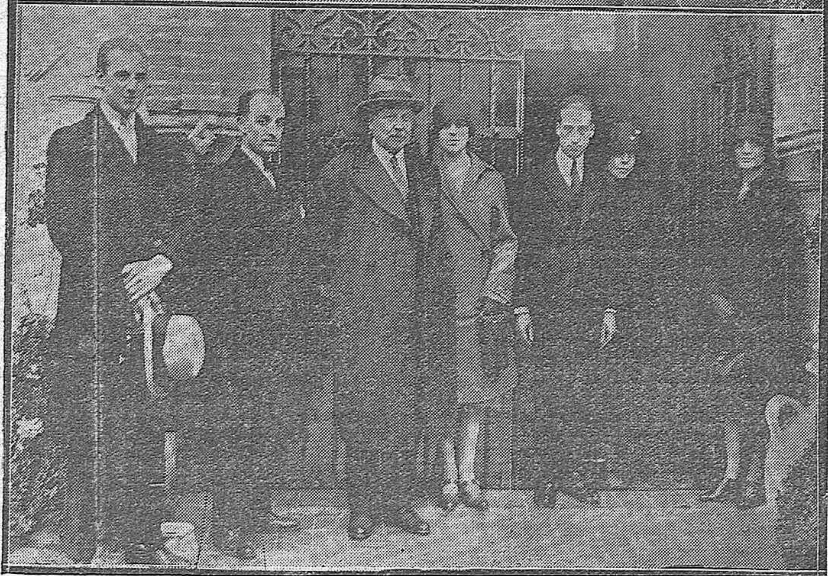
HUÉSPEDES ILUSTRES.-DON ANGEL GALLARDO, MINISTRO ARGENTINO DE NEGOCIOS EXTRANJEROS Y CULTOS, CON SU DISTINGUIDA SEÑORA E HIJOS, EN EL ESTUDIO DEL GRAN PINTOR CORDOBÉS JULIO ROMERO DE TORRES, ACOMPAÑADOS DEL TENIENTE DE ALCALDE SEÑOR VIDAURRETA Y EL PINTOR ROMERO PELLICER.-LOS DISTINGUIDOS VISITANTES AL SALIR DE VISITAR EL MUSEO DE PINTURAS.