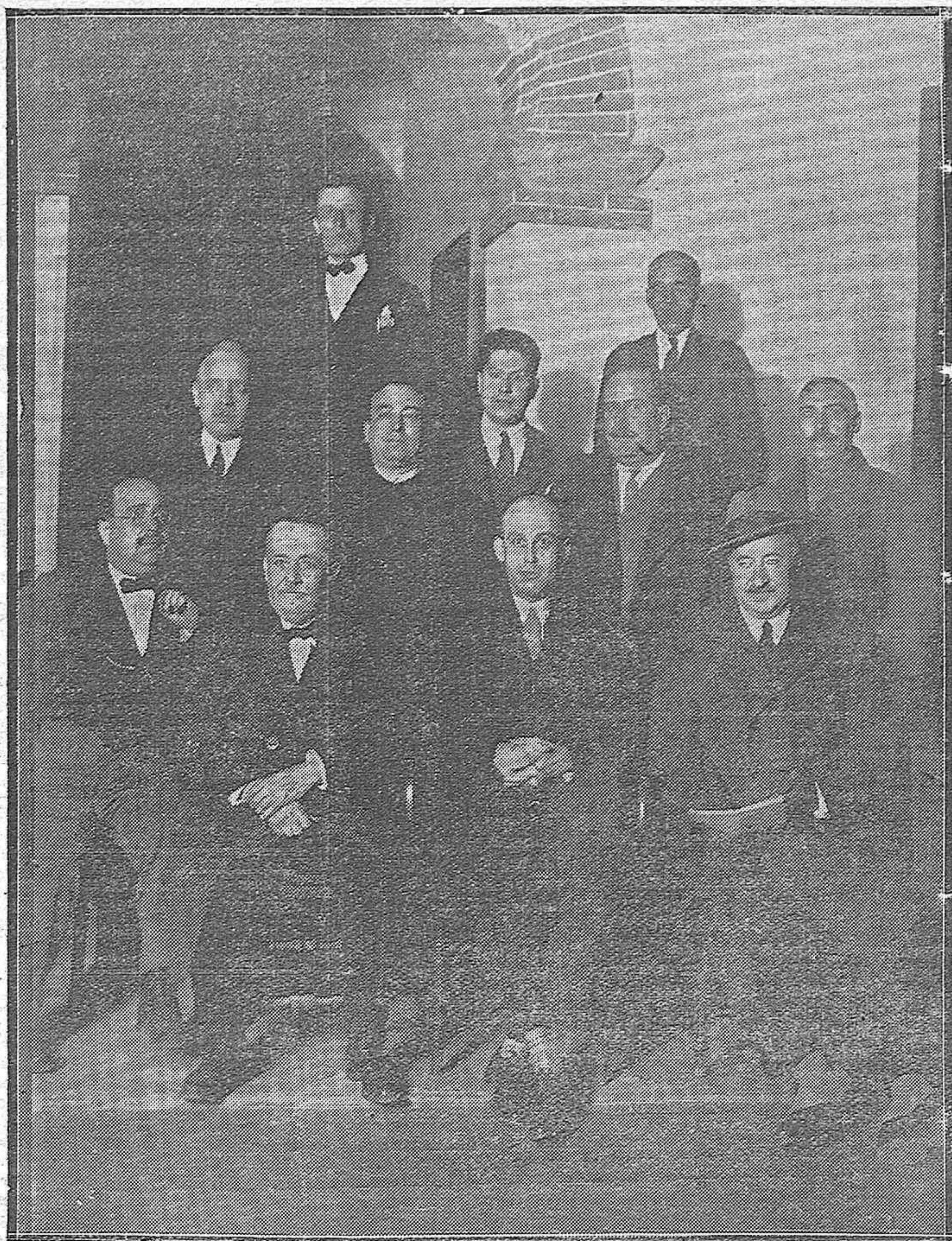
NUEVA SOCIEDAD.—La Junta organizadora de la Asociación de inquilinos de esta capital.