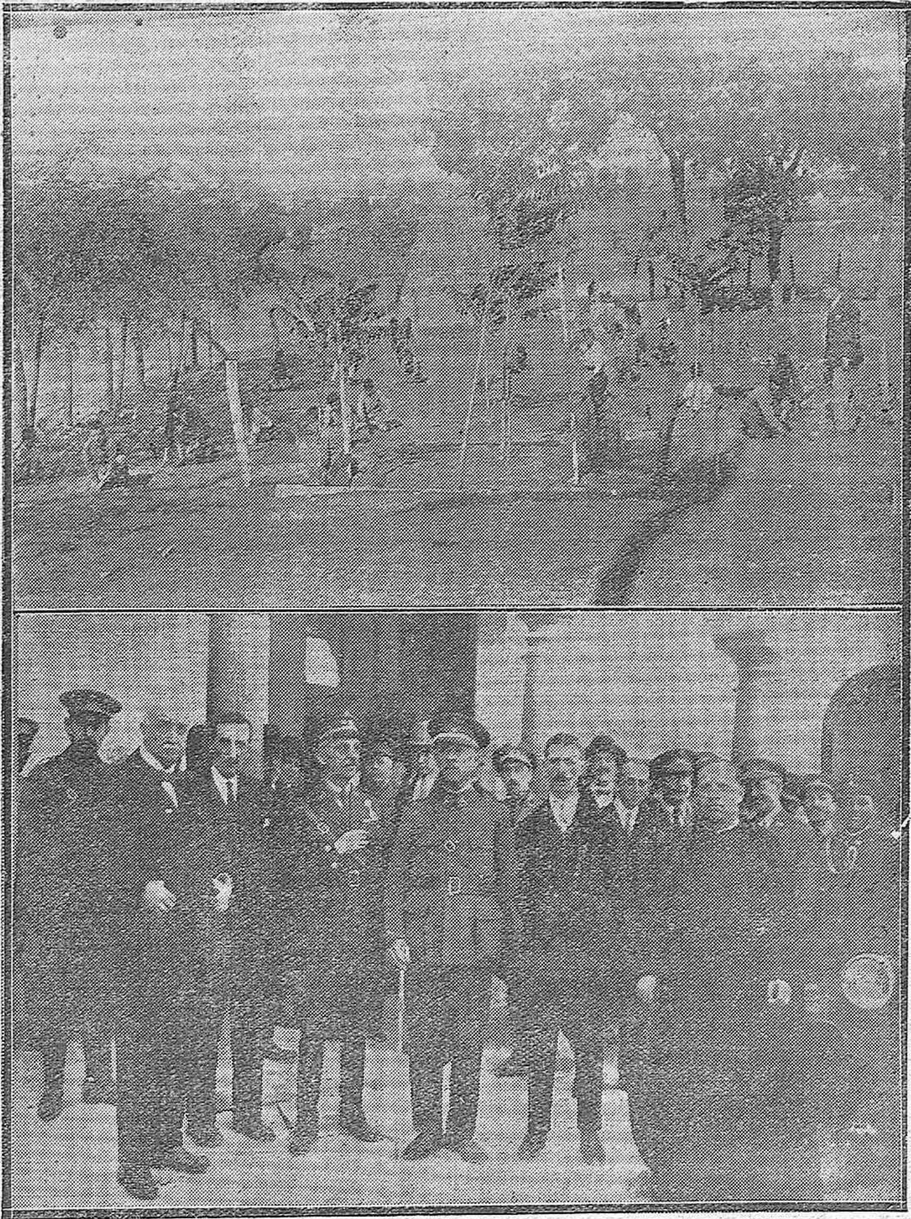
CERRO MURIANO: Pequeño Campo de Experimentación Agrícola que tiene formado el maestro nacional don Felipe Lucena, cuidándolo niños que asisten a aquella escuela nacional.—LUCENA: El General Gobernador señor Cáceres, con el alcalde y otras autoridades después de inaugurar el nuevo cuartel de la Zona de Reclutamiento.