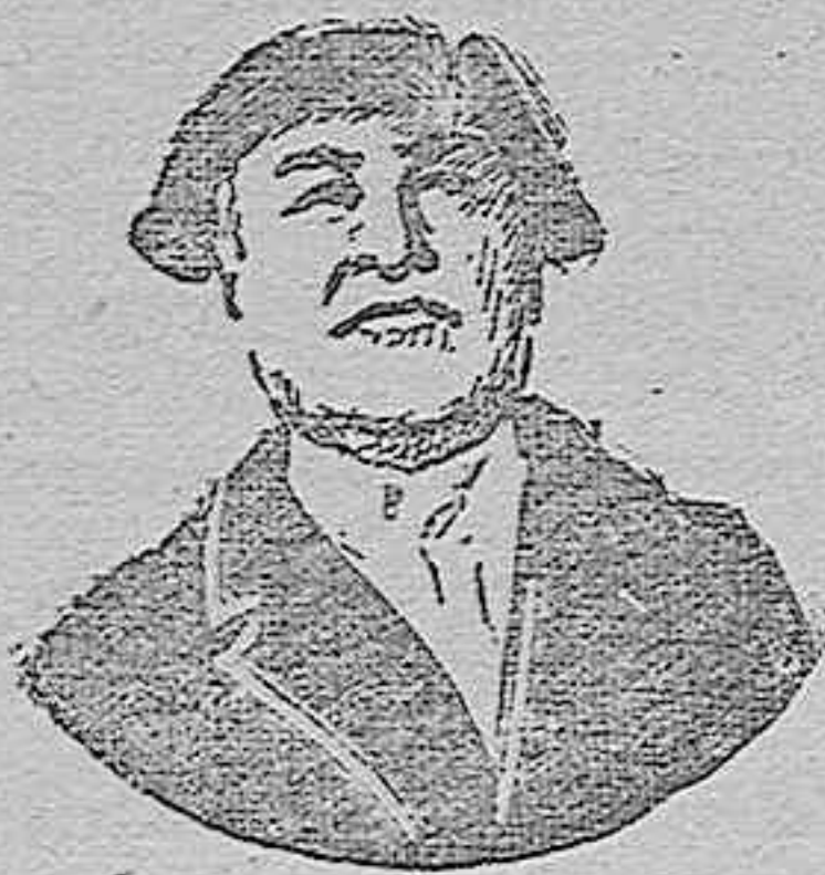
El genial humorista ruso. Arkadi Avertchenko

—Luego él morirá víctima del delirio alcohólico, junto a los niños aterrados y temblorosos. Y ellos, horrorizados, mirarán