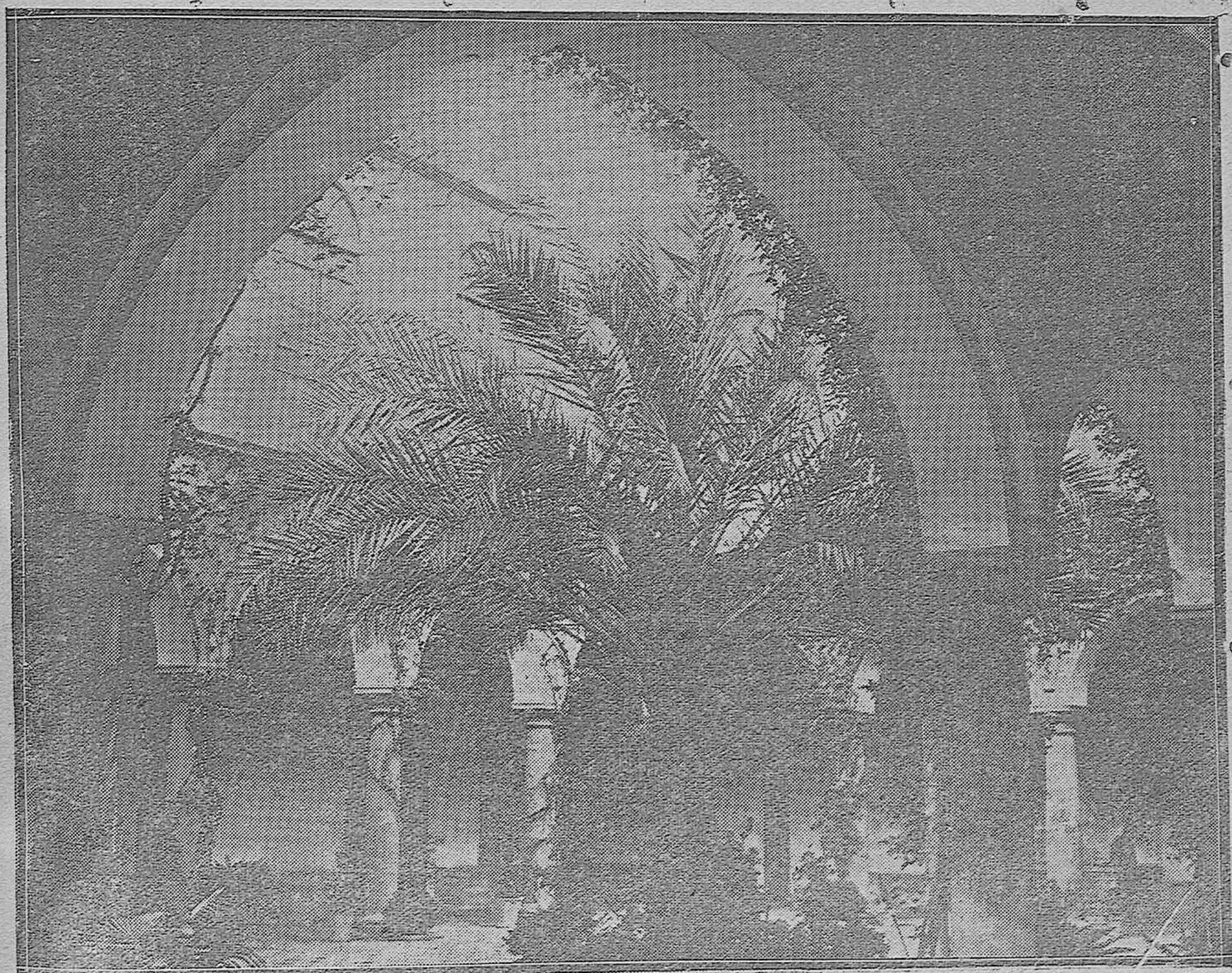
Interesante vista del primoroso patio cordobés de la casa del Marqués de Viana.