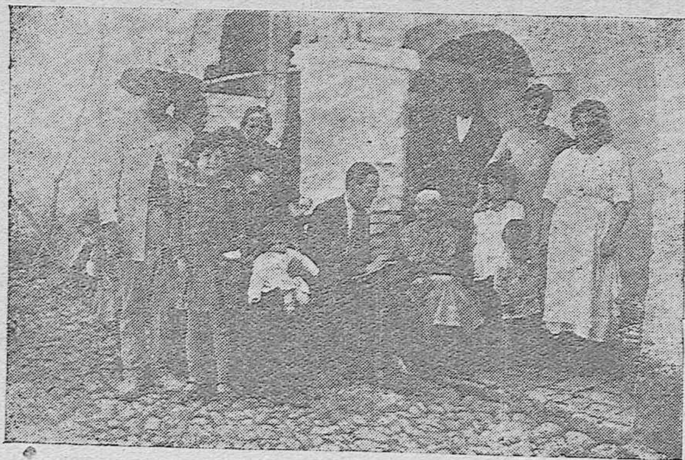
LA CENTENARIA DEL CAMPO DE LA VERDAD, REFIRIÉNDONOS DETALLES DE SU VIDA