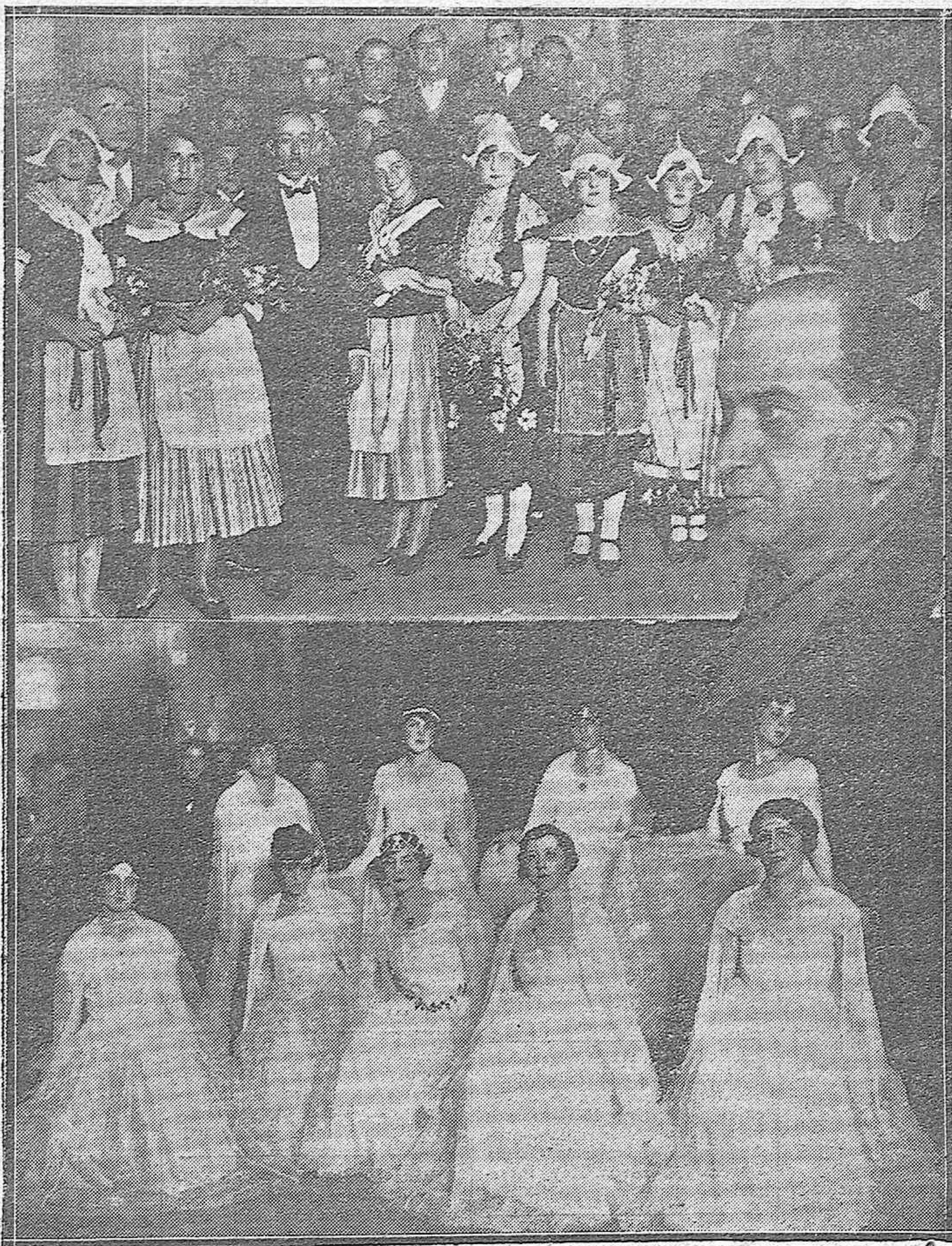
FESTIVAL BENEFICO EN EL GRAN TEATRO.—BELLÍSIMAS SEÑORITAS DE LA BUENA SOCIEDAD CORDOBESA QUE TOMARON PARTE EN EL FESTIVAL DE LA ACCIÓN CATÓLICA DE LA MUJER.—CUADRO ARTÍSTICO DE LINDAS SEÑORITAS QUE ACTUÓ AL FINAL.—EL PERIODISTA SEVILLANO SEÑOR QUIÑONES QUE HA DIBIGIDO LAS FUNCIONES.