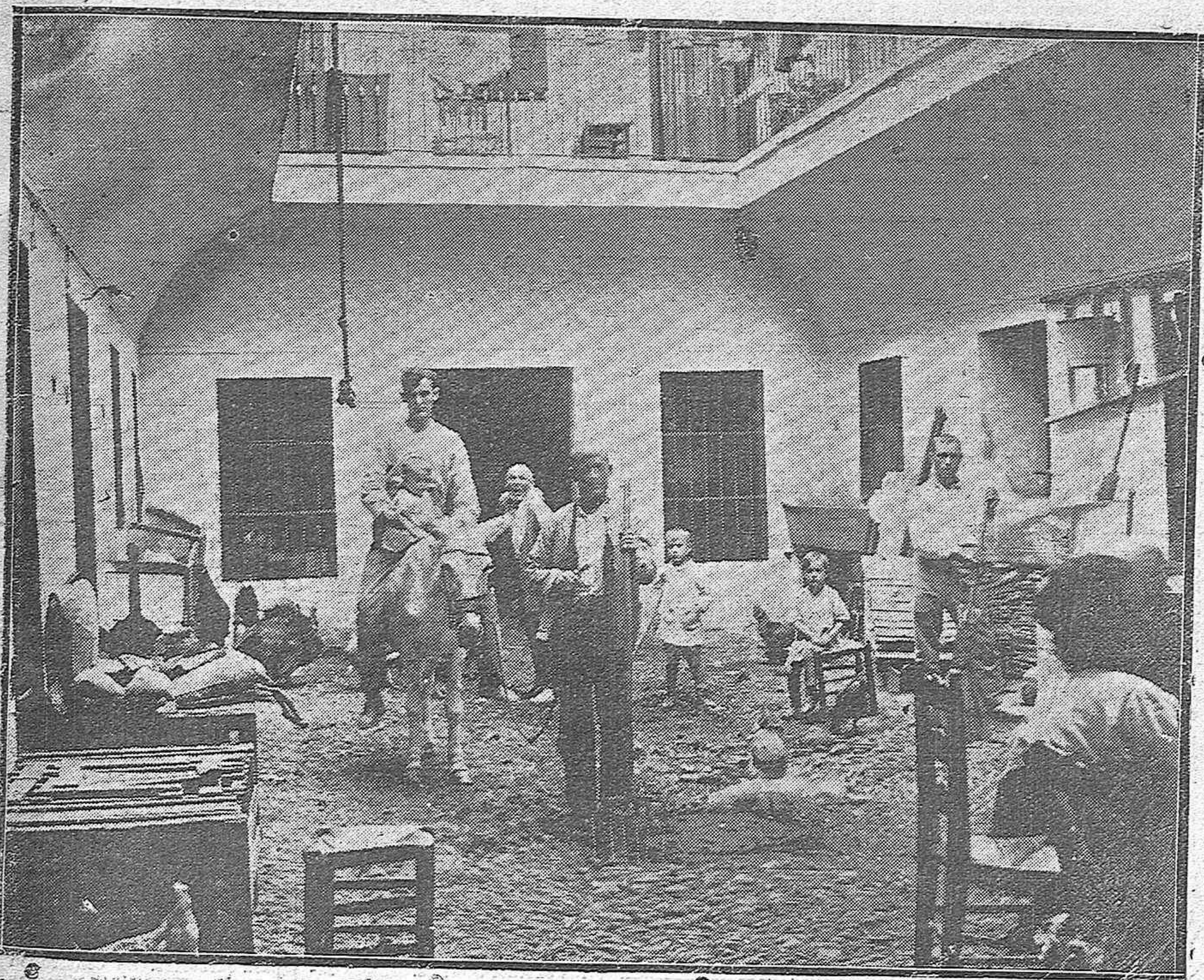
Patío de vecinos de la famosa posada del Sol, en pleno corazón de la Plaza del Mercado.