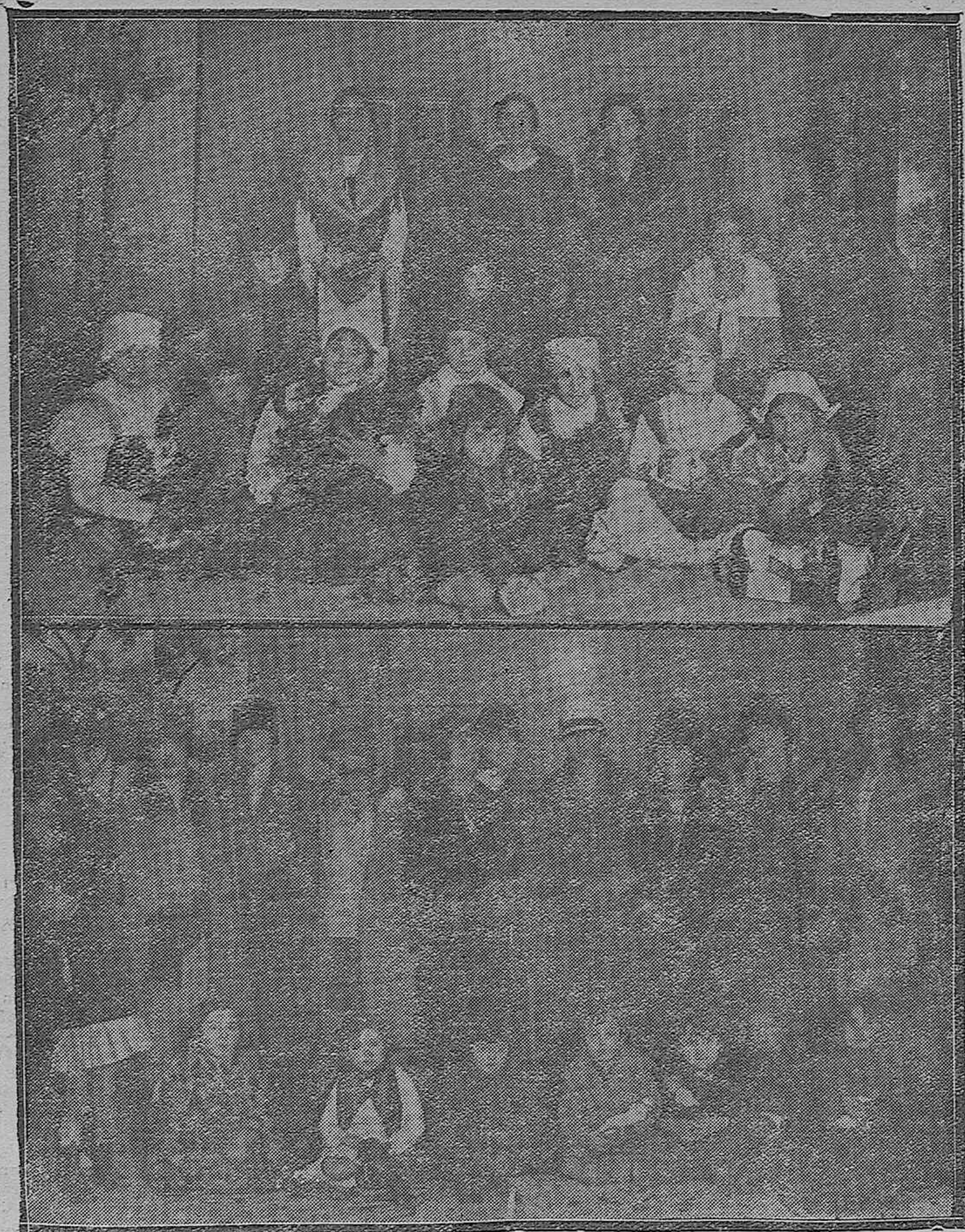
EN LAS ESCUELAS DEL SAGRADO CORAZÓN DE JESÚS.—Preciosas niñas que tomaron parte en la velada teatral.—Bellas señoritas que forman la asociación de María Inmaculada y que confeccionaron ropas para regalárselas a las niñas pobres que asisten a estas escuelas.