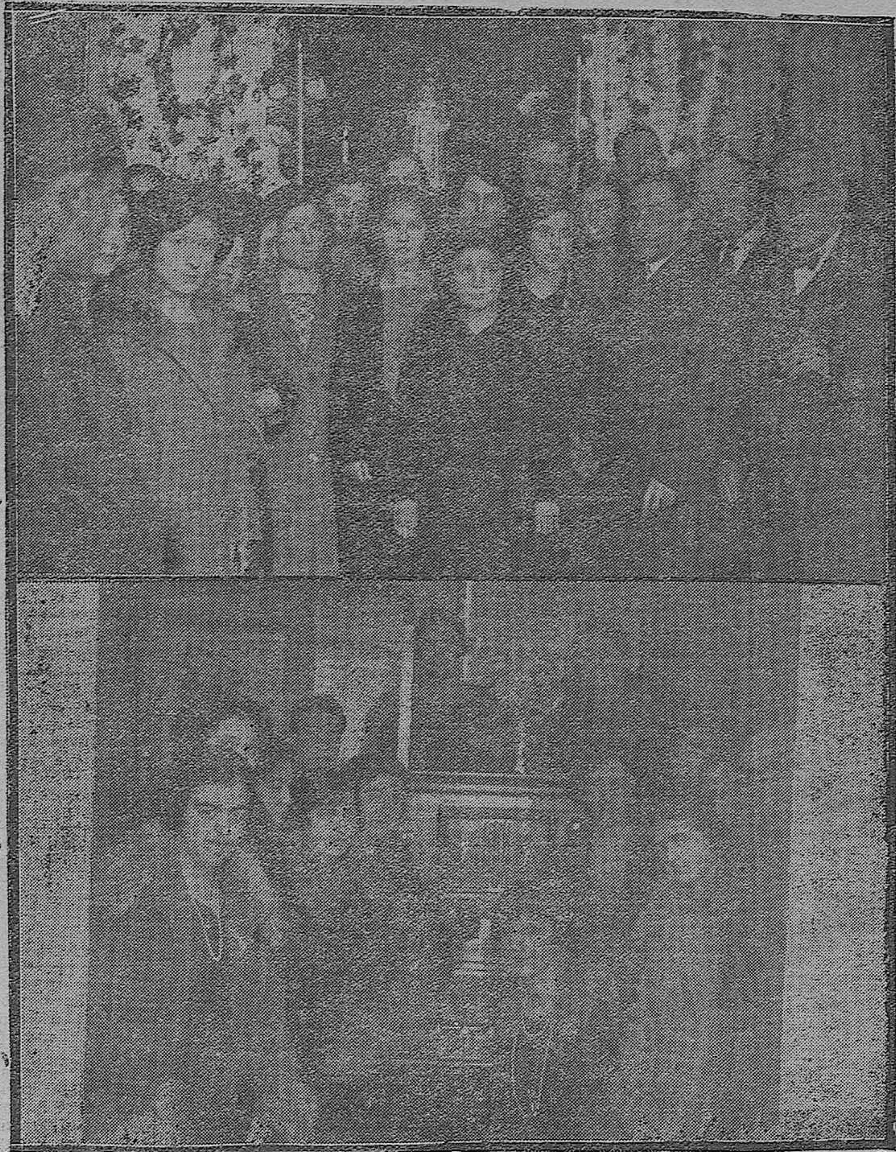
ESPEJO: Inauguración de la Central de Teléfonos: señoritas que asistieron a la bendición del local.—MONTILLA: lindas señoritas telefonistas al lado del Cuadro, después de inaugurado el servicio telefónico en dicho pueblo.