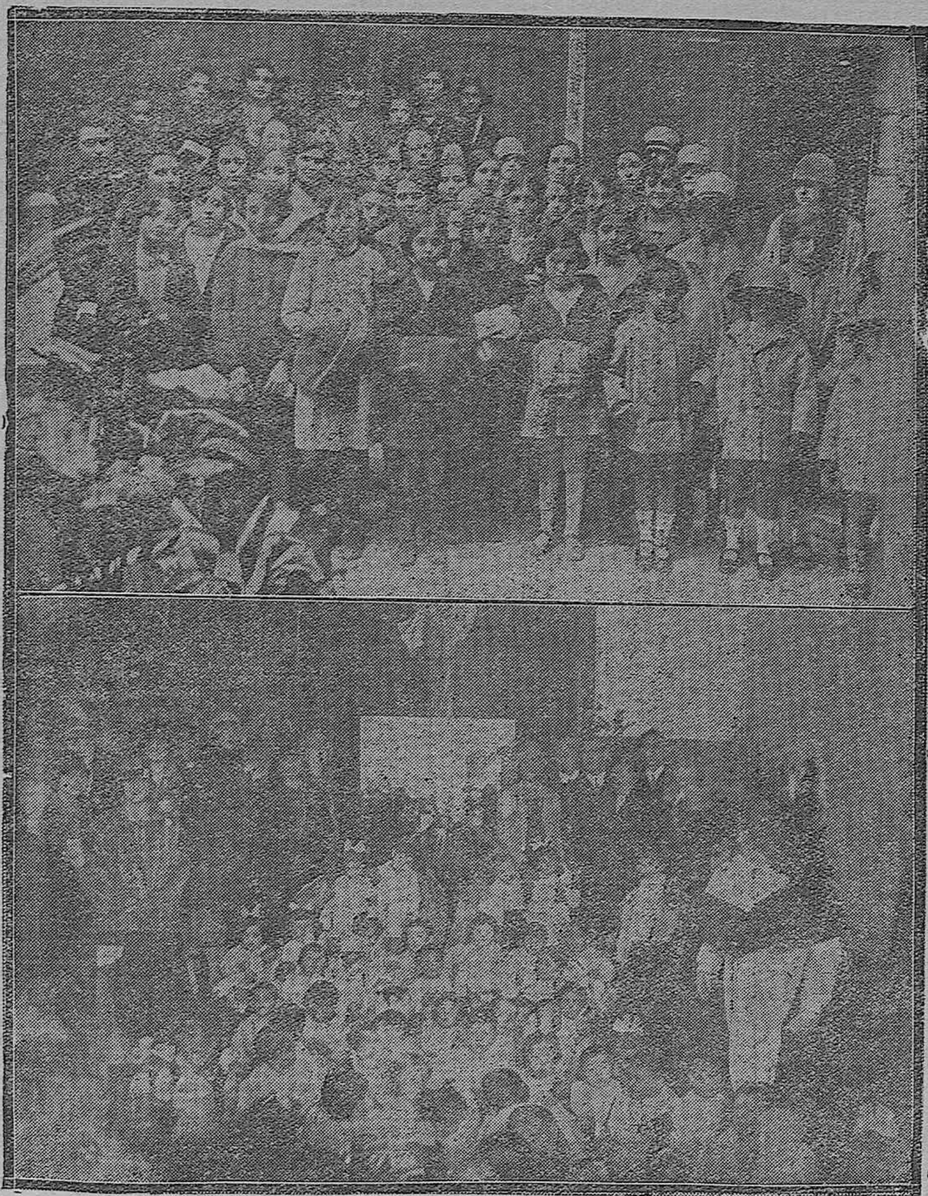
El Coro angélico de la Acción Católica de la Mujer reparte prendas de vestir a sus obreras.—En la Casa del Niño: reparto de juguetes con motivo de las actuales Pascuas.