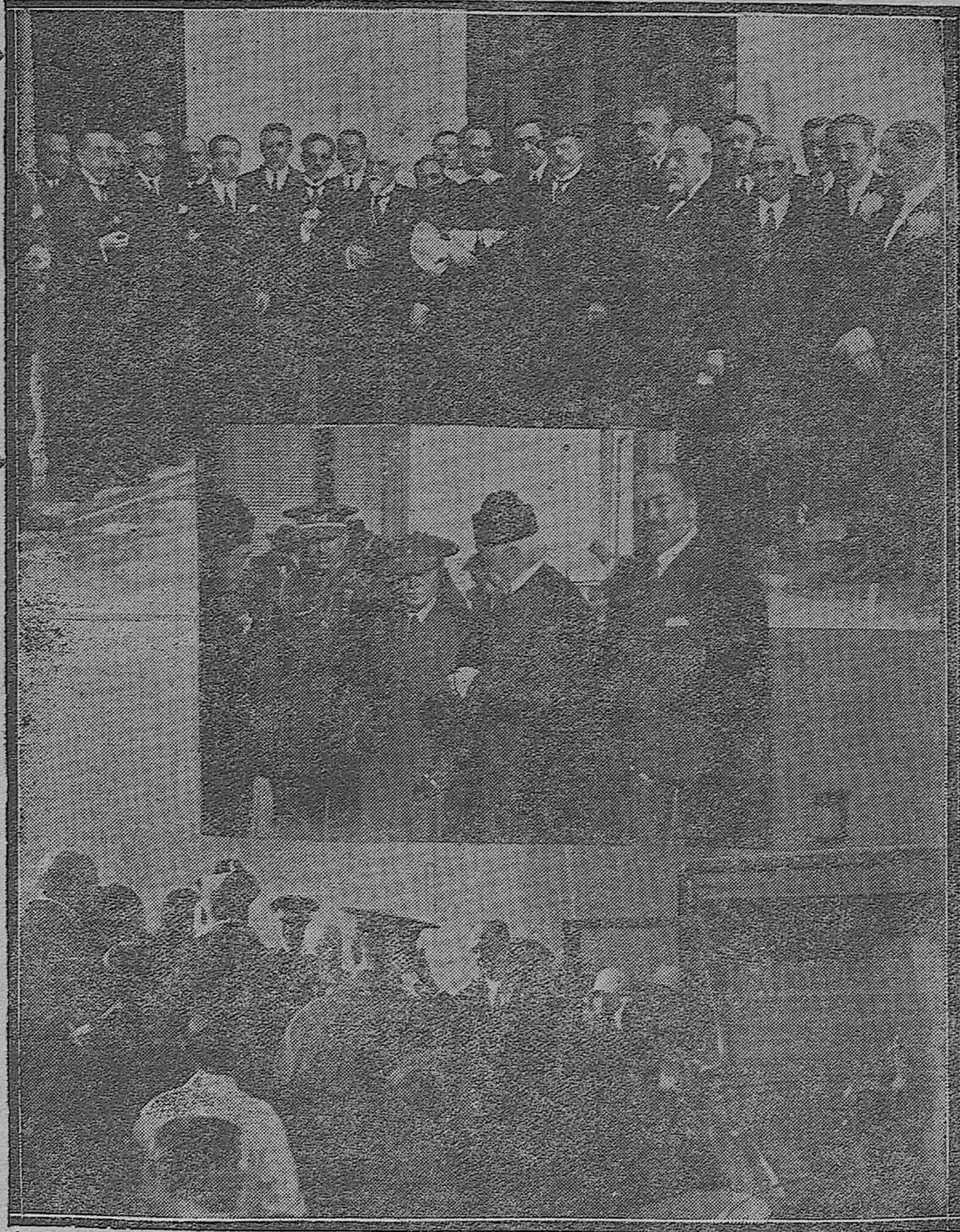
Varios momentos de los actos celebrados por los abogados cordobeses en honor de sus Santos Patronos.