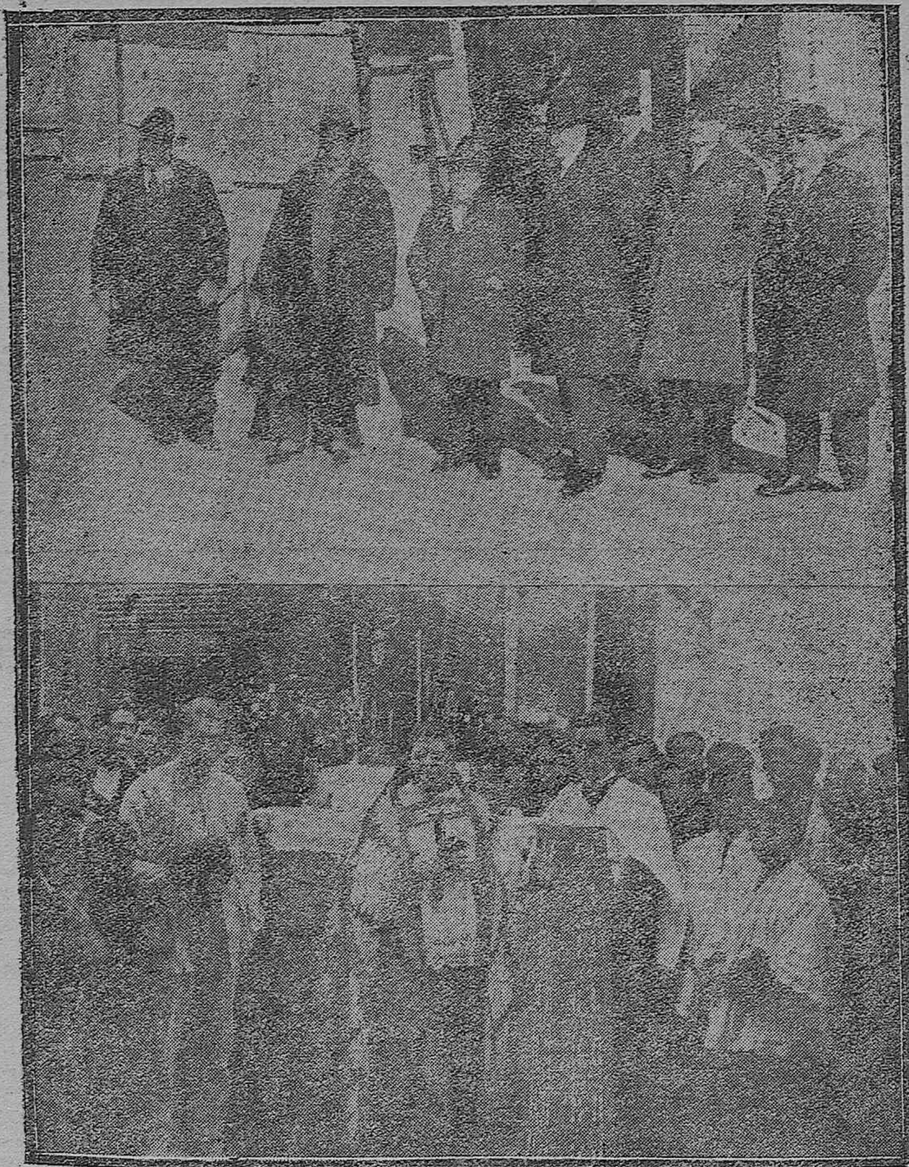
PUEBLONUEVO DEL TERRIBLE.—Las autoridades provinciales y locales y los directores de la Compañía de Peñarroya visitando las obras del Grupo Escolar.—Bendición del Mercado de Abastos, antes de su inauguración.