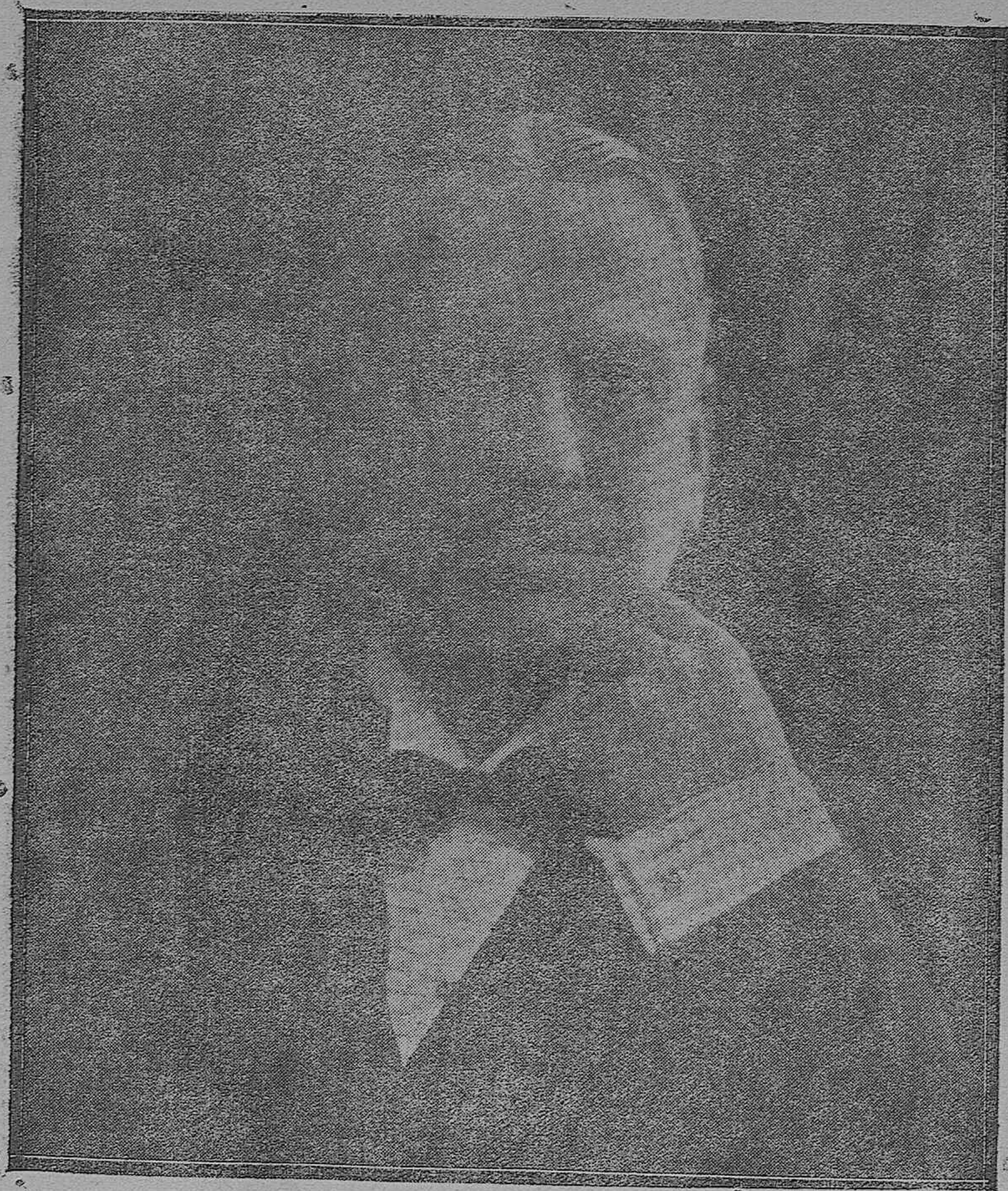
El marqués de Viana, de ilustre abolengo cordobés y Sumiller de Corps del Rey, que acaba de ser agraciado con la preciada condecoración del Toisón de O.º.