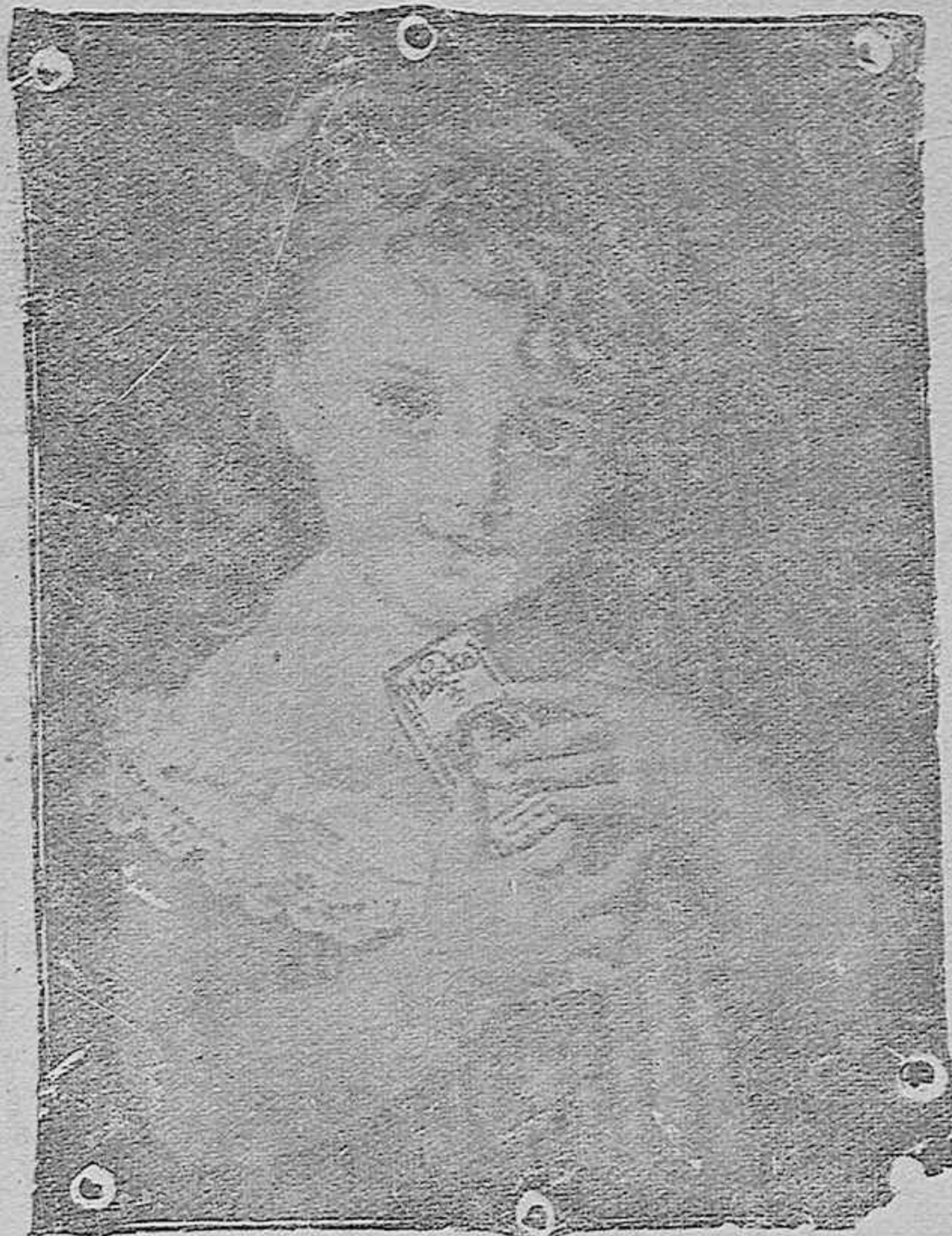
"La niña del Maizkal"