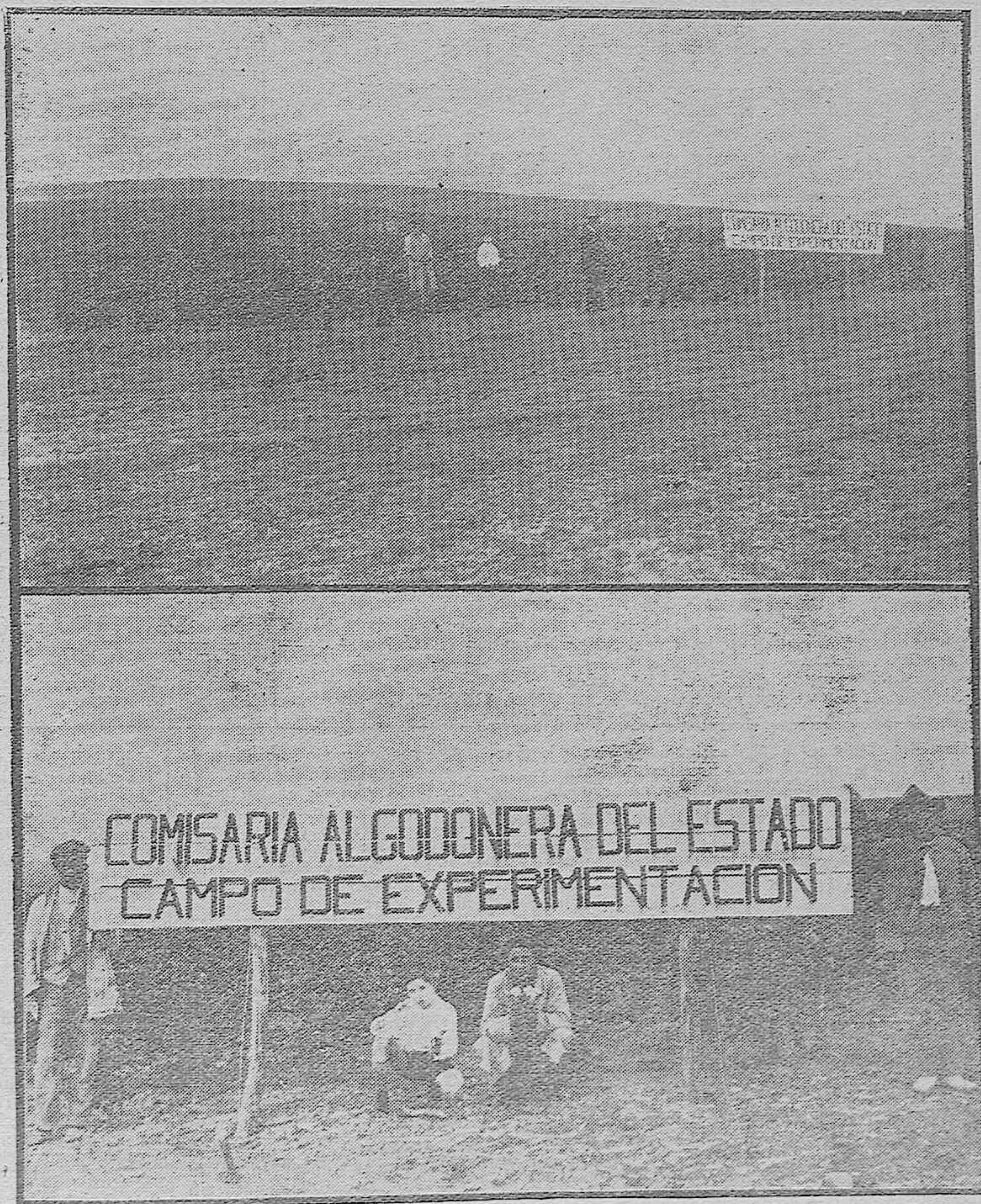
CULTIVO DEL ALGODÓN EN CÓRDOBA.—Vistas del campo de Experimentación del cultivo del Algodón presentando una producción extraordinariamente ventajosa.