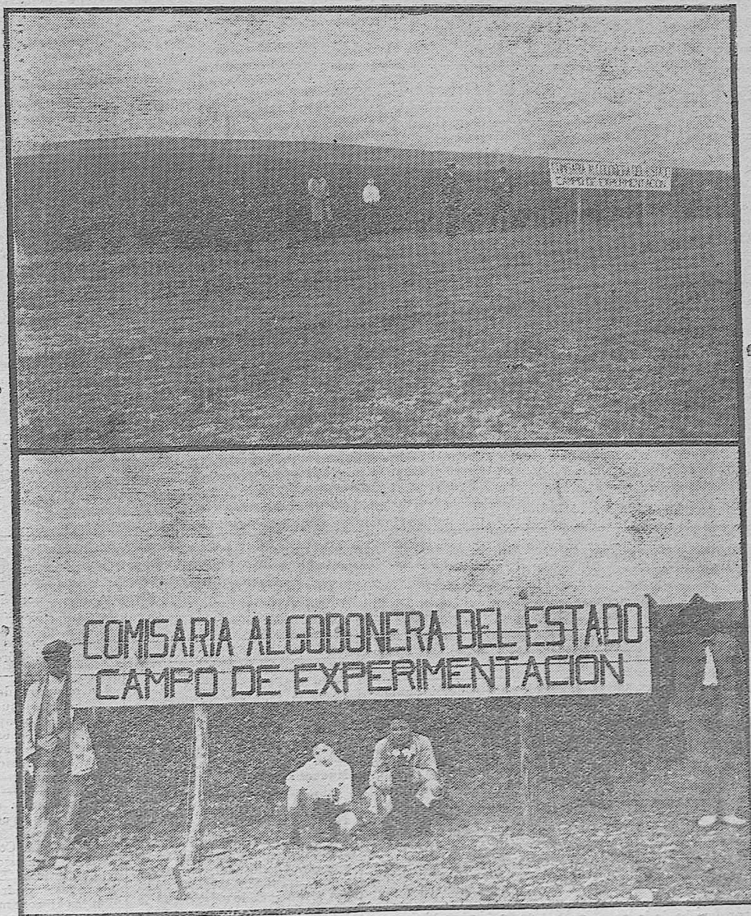
CULTIVO DEL ALGODÓN EN CORDOBA. — Vistas del campo de Experimentación del cultivo del Algodón presentando una producción extraordinariamente ventajosa.