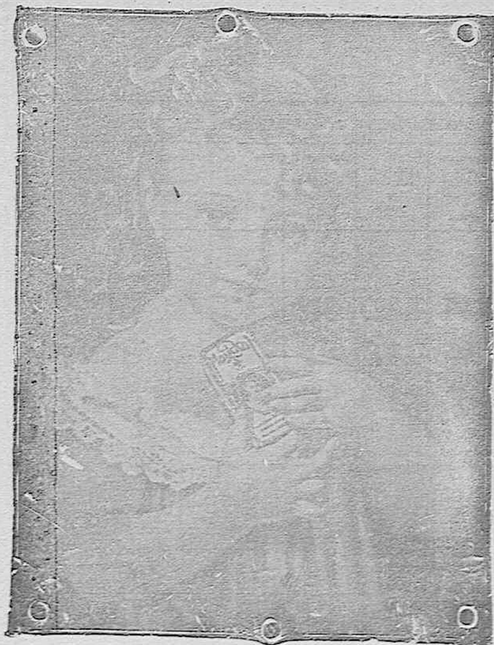
“La niña del Maizkal”

CORTES de traje de entretiempo en El Metro, y sus 3 Sucursales surtido reciente y precios convenientes.