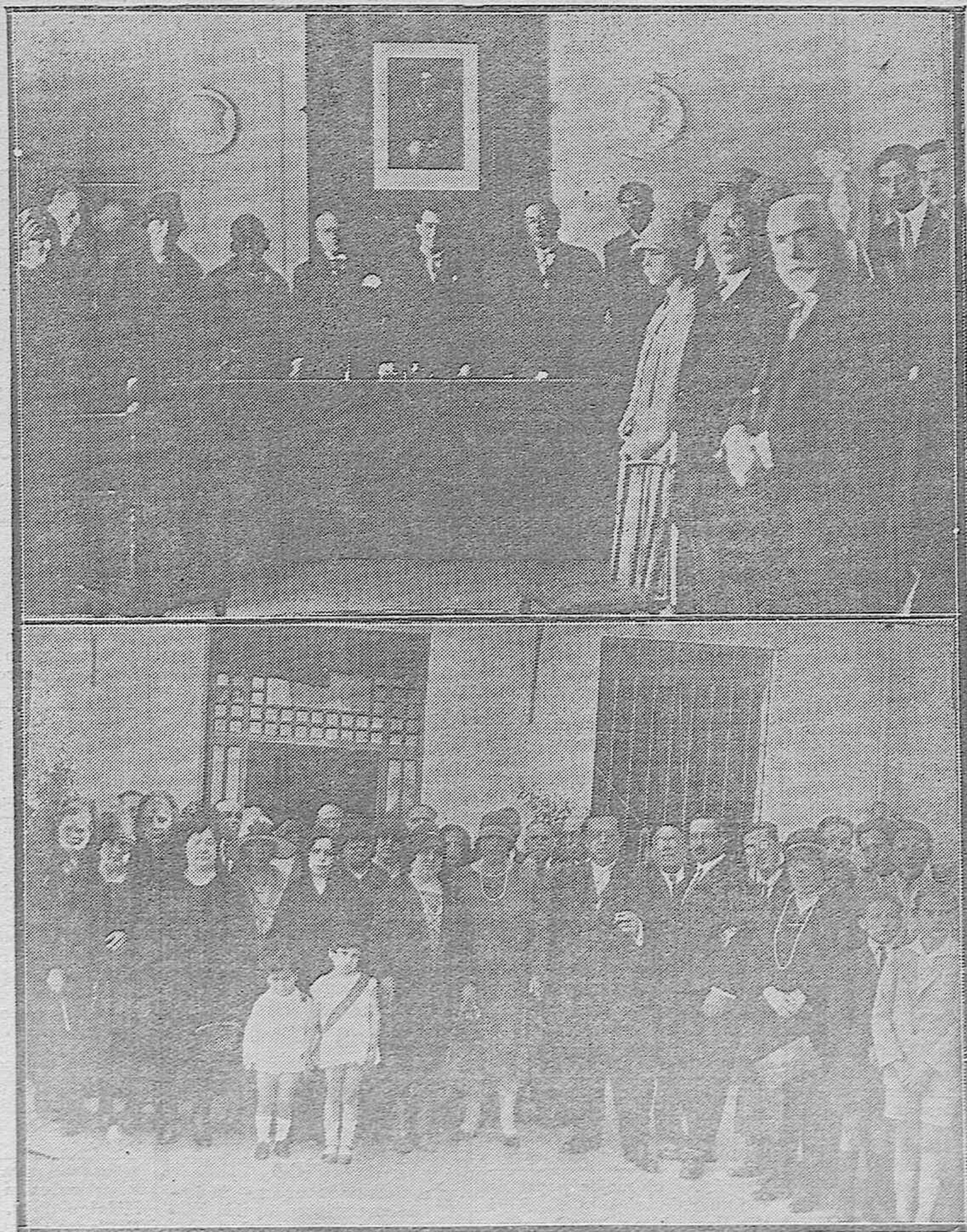
LA FIESTA DEL MAESTRO. — Aspecto del Salón de Actos de la Escuela Normal de Maestros durante el acto de descubrir una lápida con los nombres de tres Maestros fallecidos de Córdoba.—El Inspector de Primera Enseñanza, señor Priego, con los Maestros Nacionales que asistieron a la fiesta.