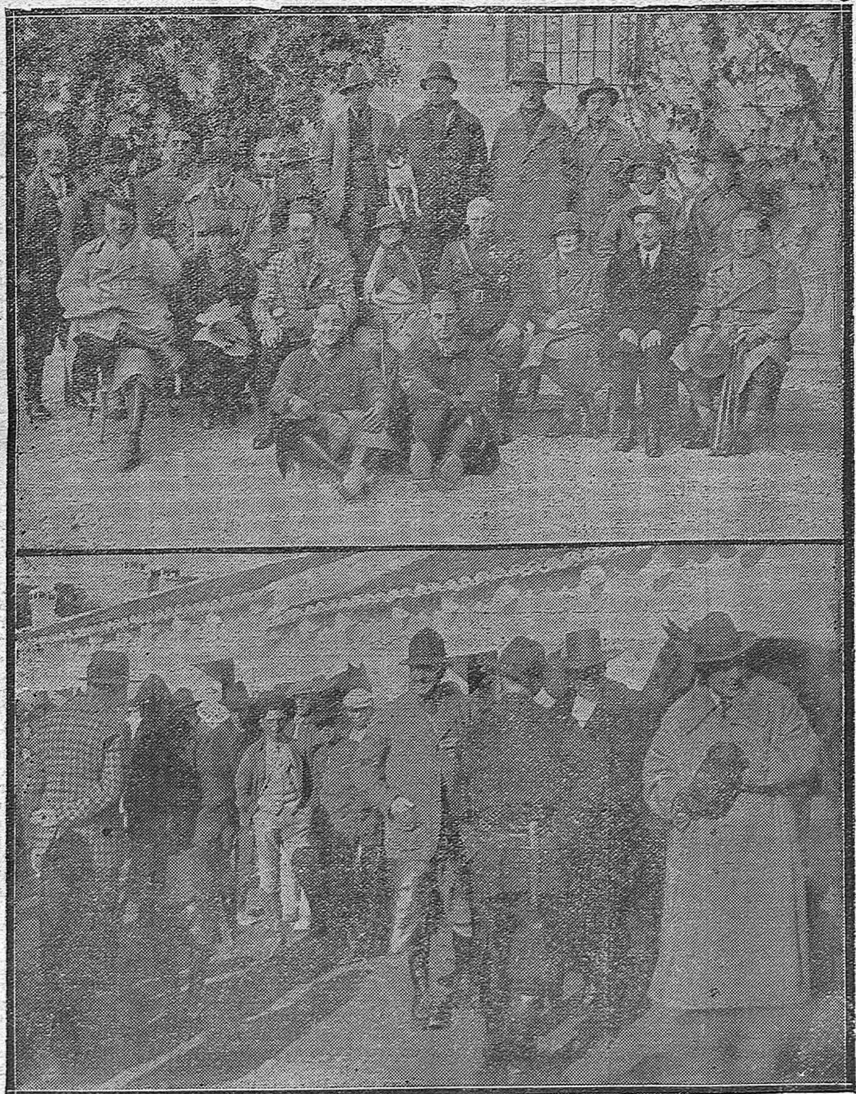
Don Alfonso XIII, general Primo de Rivera, ministro de Estado, príncipe de Razinvili e ilustres aristócratas-monteros, en el palacio de Moratalla, antes de salir para la montería del «Rincón». Grupo organizado expresamente a nuestro reporter gráfico señor Santos.—El popular «Guerrita» dispuesto para montar en el «Rincón».