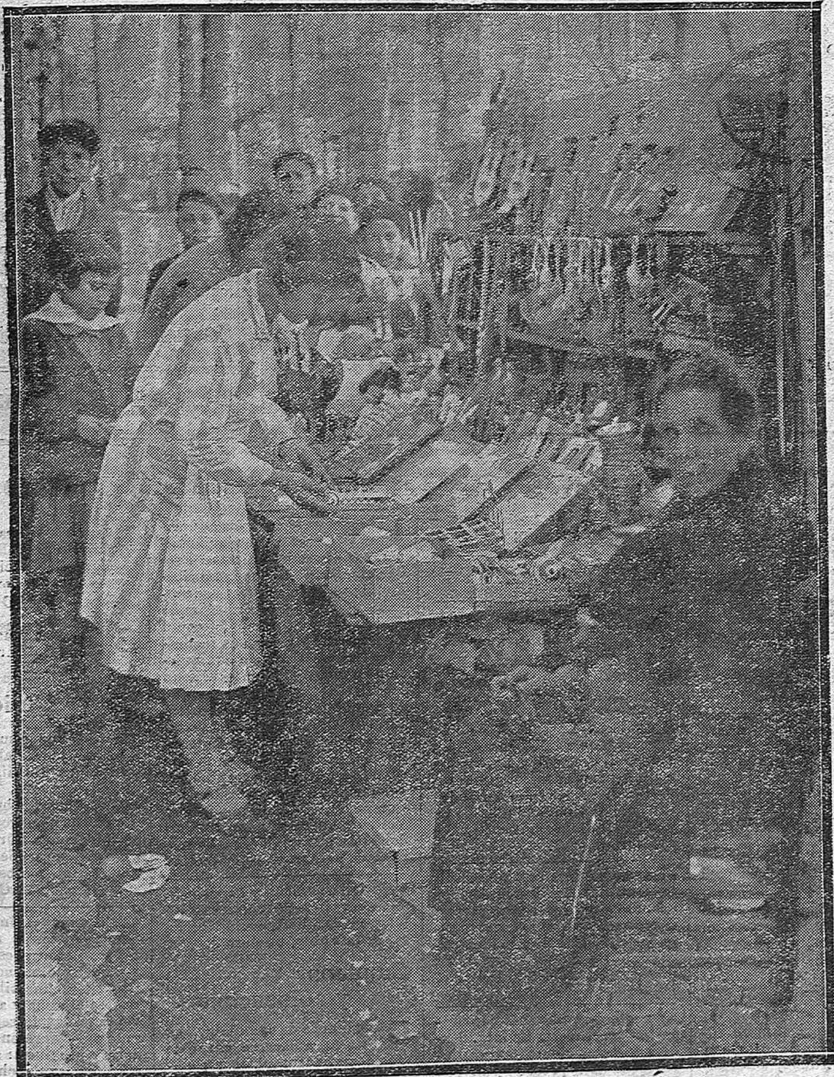
ESCENAS POPULARES.—Una simpática nena cordobesa, rebuscando en un típico tenderete de la calle Claudio Marcelo, alguna baratija con que realzar los encantos de su gracia andaluza.