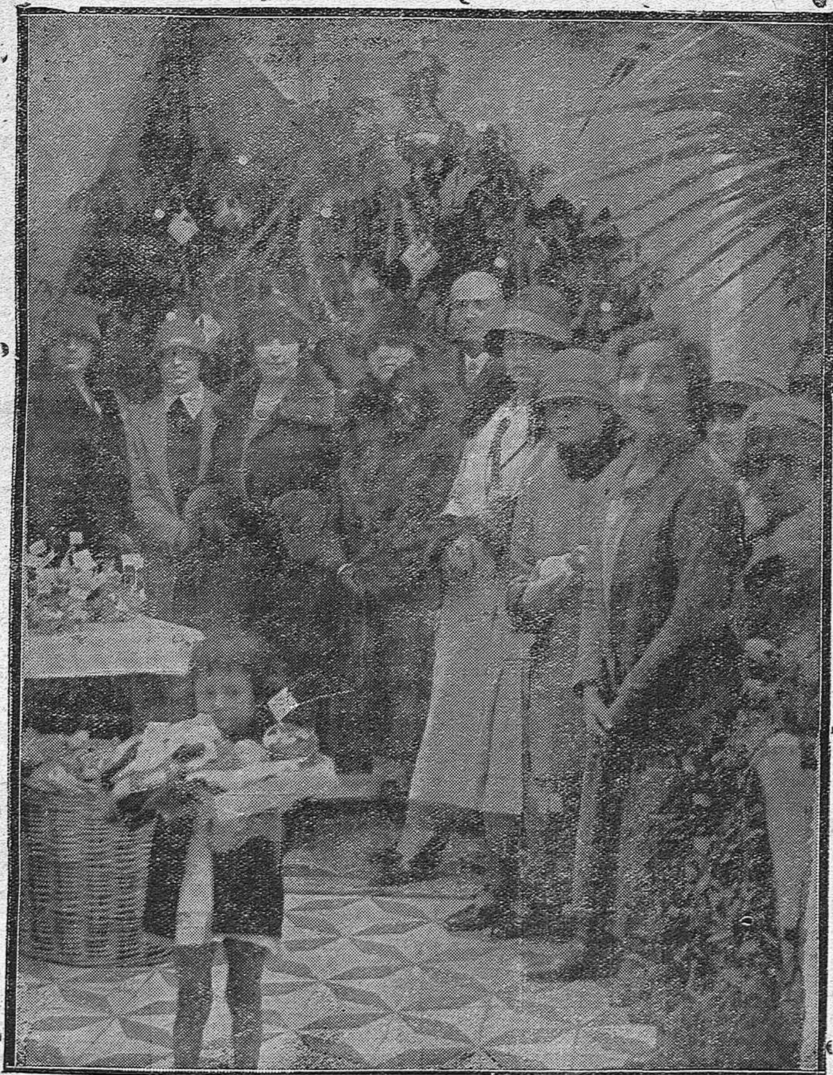
EN EL DISPENSARIO DE LA CRUZ ROJA.—La distinguida señora de Cruz Conde presidenta de la Junta de asistencia en la benéfica institución, con las damas que forman la Junta de Honor, repartiendo juguetes a los niños que recibieron asistencia el año anterior.