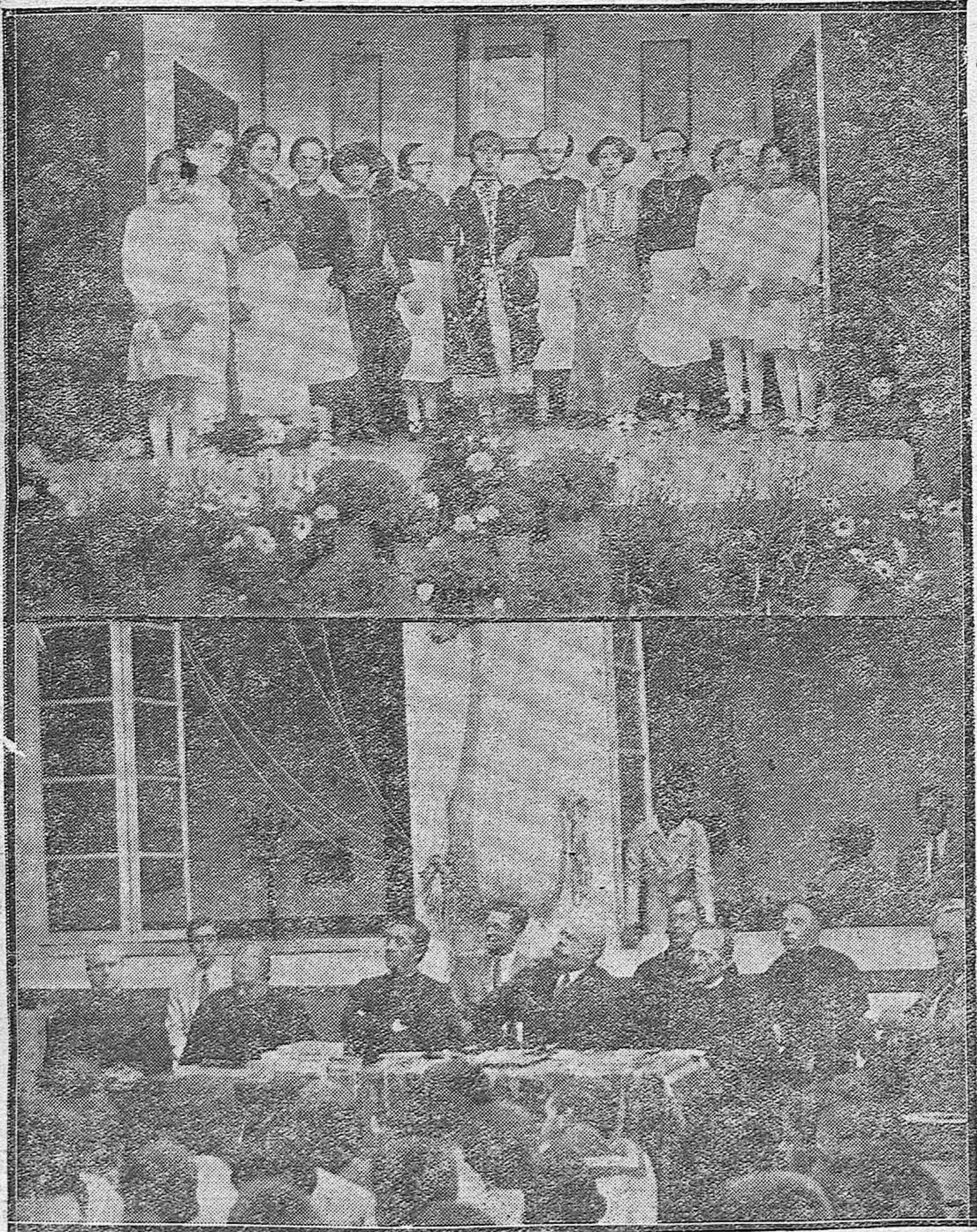
DE LAS PASADAS FIESTAS ESCOLARES.--Distinguidas jóvenes que representaron una función en Jesús Nazareno.--Las autoridades en el Colegio de San Hipólito.