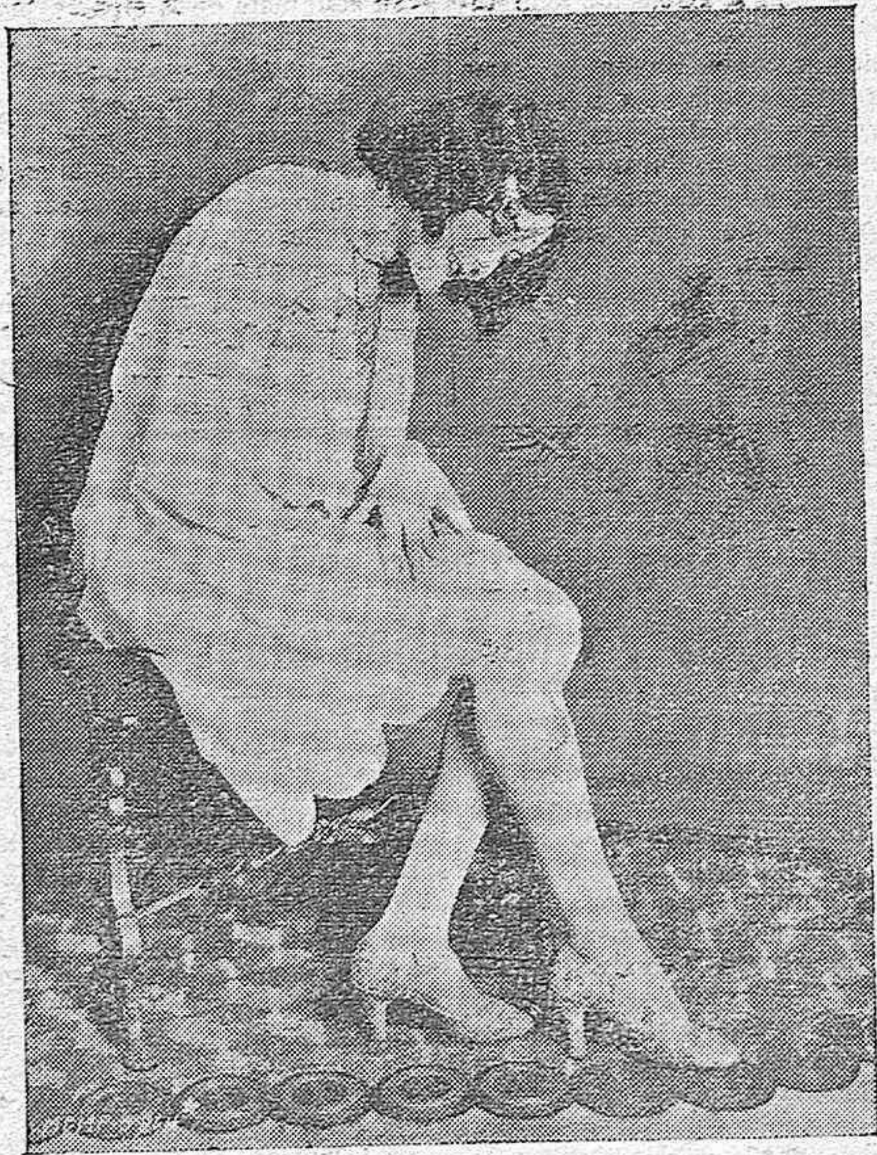
RAQUEL TORRES, LA BELLÍSIMA STAR DE CINE CONTEMPLA SUS MEDIAS PINTADAS SEGÚN LA ÚLTIMA POSTURA DE LA MODA.