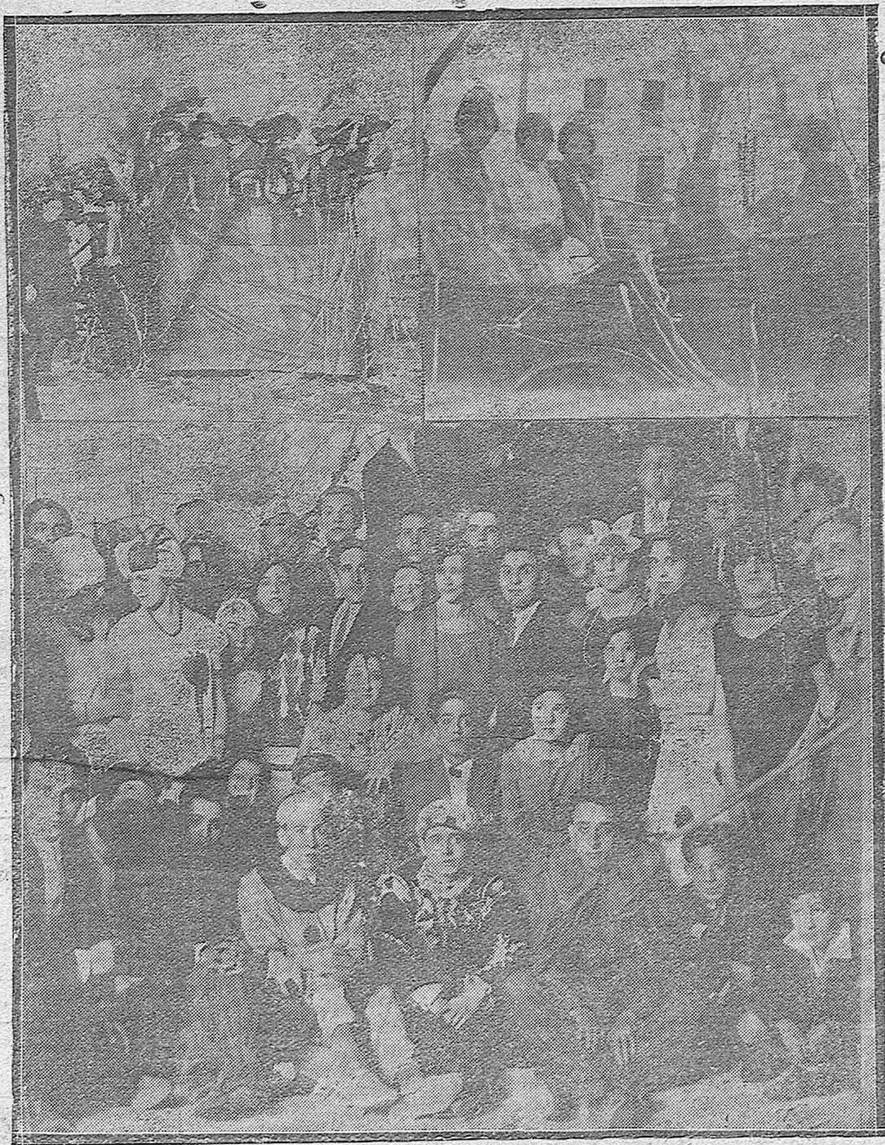
NOTAS DE CARNAVAL.—La carroza «Viva Córdoba» ocupada por distinguidas señoritas.— Tres bellas concurrentes al paseo de la Victoria.—Grupo de concurrentes a uno de los animados bailes que han celebrado las distintas sociedades recreativas de esta capital.