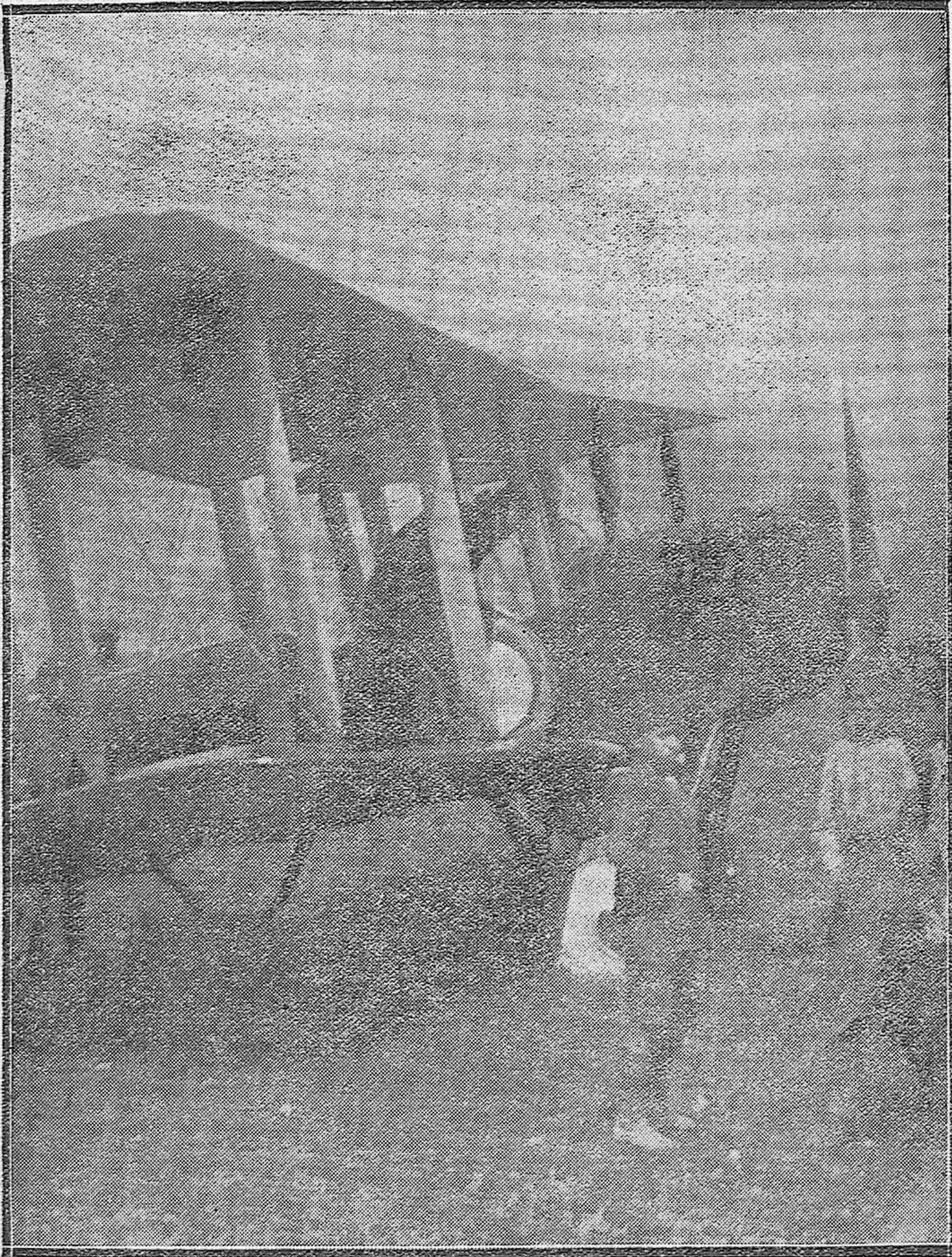
El aviador militar señor Rexach, cambiando una de las ruedas a su aparato al aterrizar ayer por falta de esencia en los llanos de la Electromecánica.