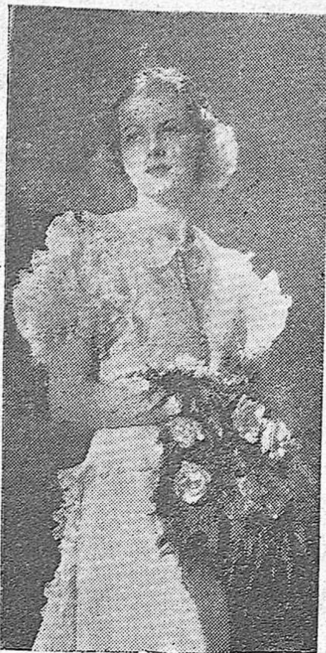
Betty Furnes, graciosa actriz de la Metro Goldwyn Mayer, que ha obtenido éxitos extraordinarios en sus diversas interpretaciones cinematográficas