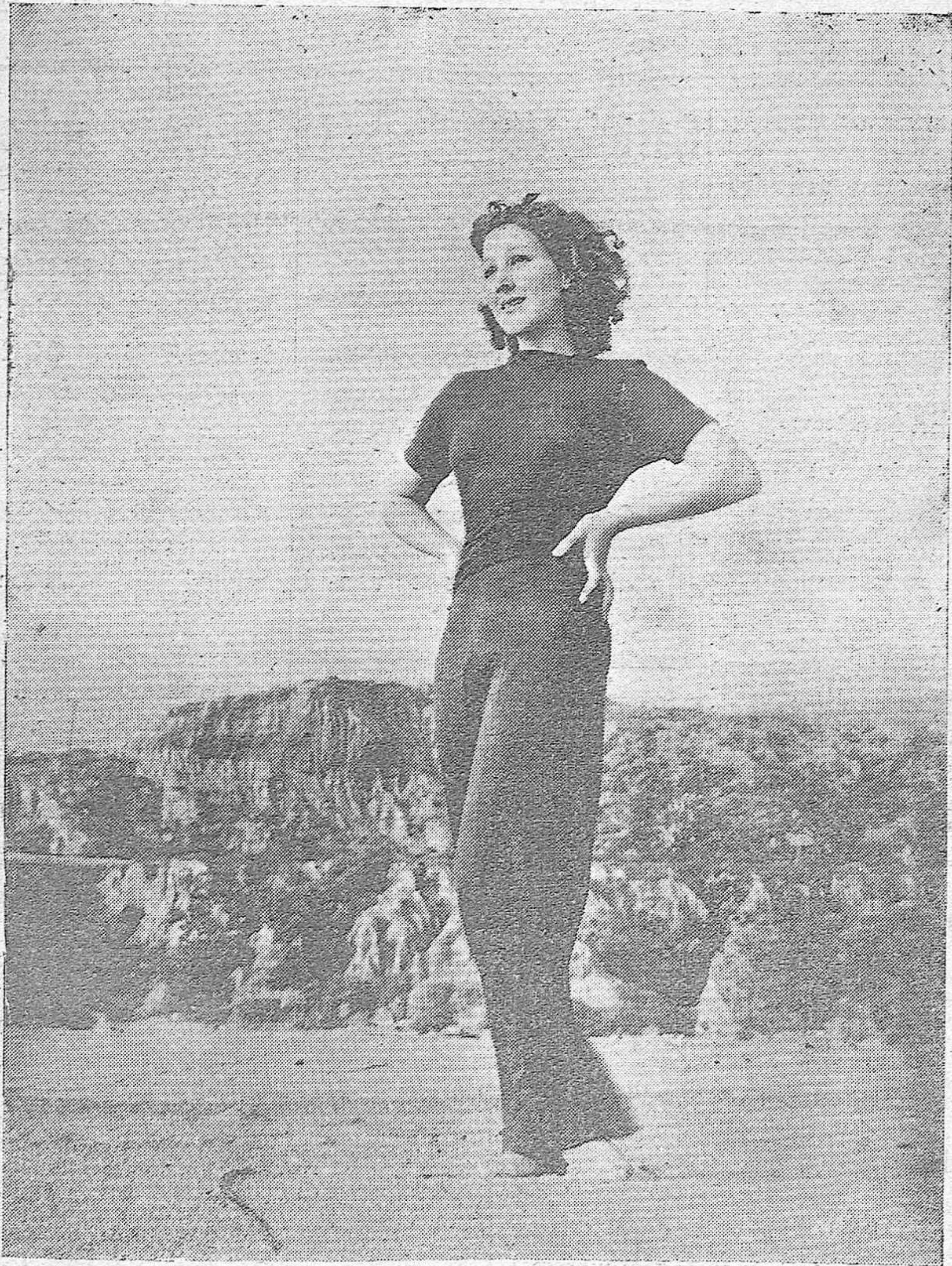
Una de las más bellas artistas de la Metro-Goldwyn-Mayer, Jean Parker, aparece ante los lectores de LA VOZ con una elegante toilette de playa. La gran actriz cinematográfica descansa de sus trabajos de la pantalla en unas vacaciones estivales.