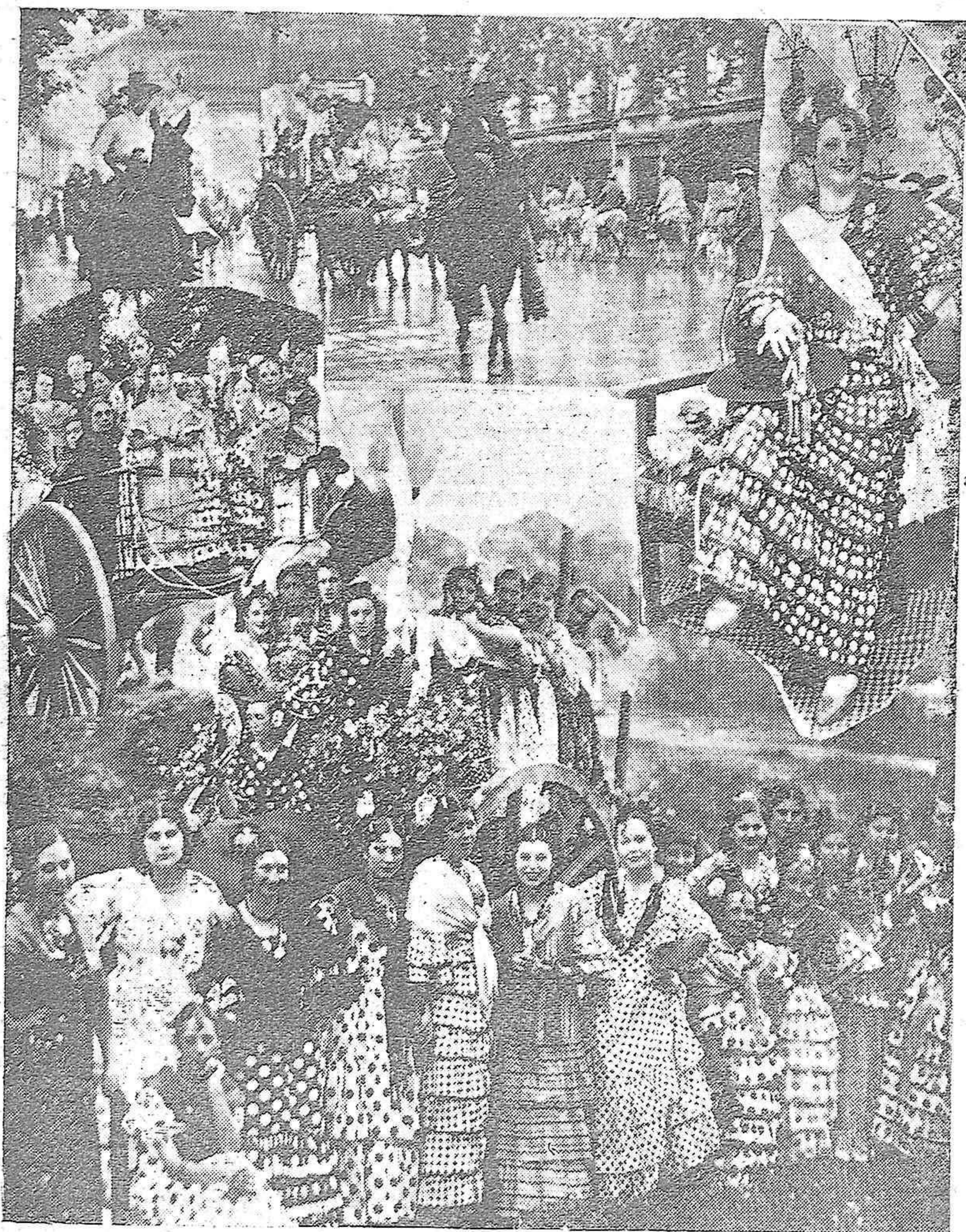
Varios detalles de la gira organizada por la simpática "Peña de los 99", al Santuario de Linares, con motivo de su pintoresca romería.