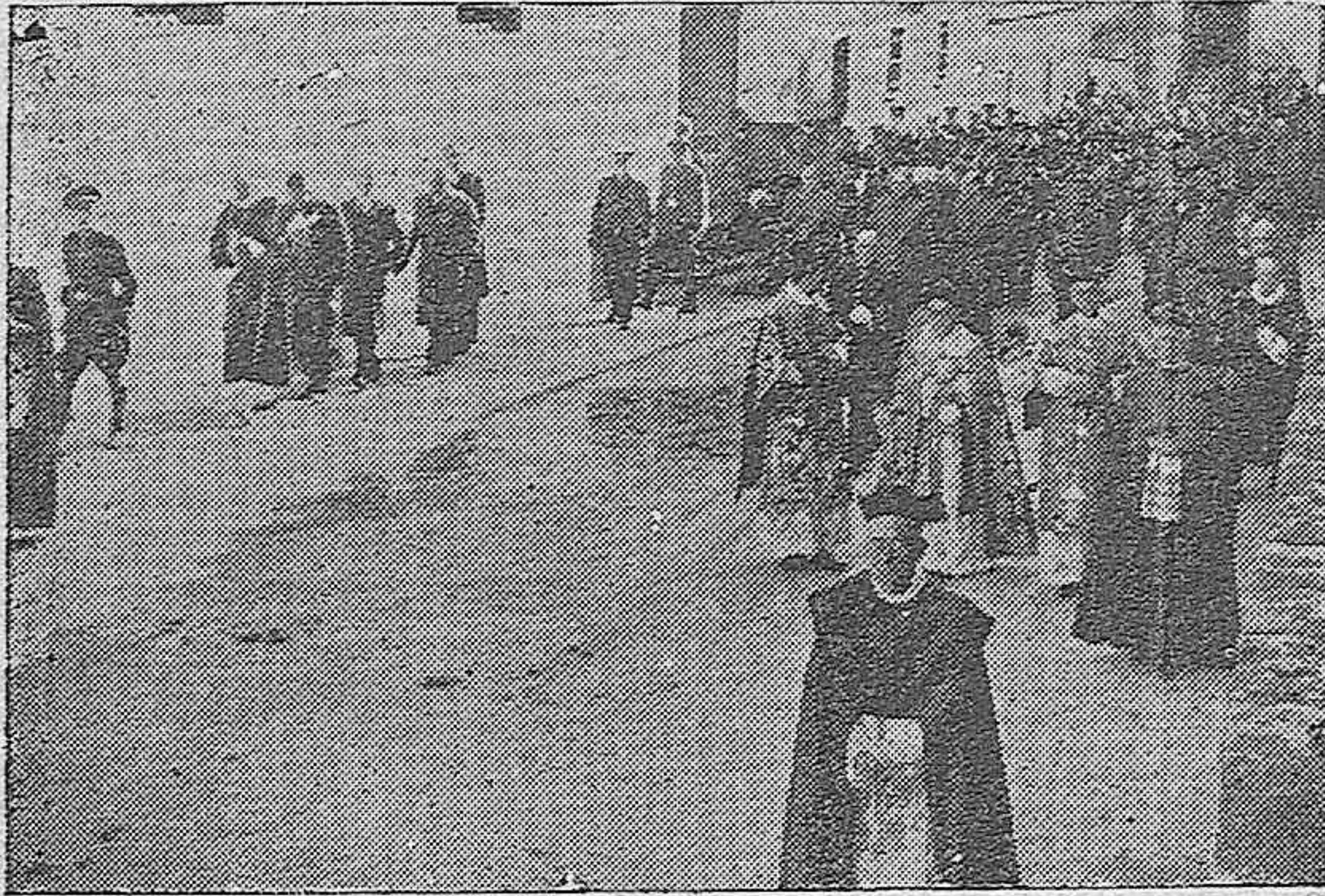
Los Excelentísimos Cabildos Catedral y Municipal, después de asistir a la fiesta religiosa en honor de las Sagradas Reliquias de los Santos Mártires de Córdoba