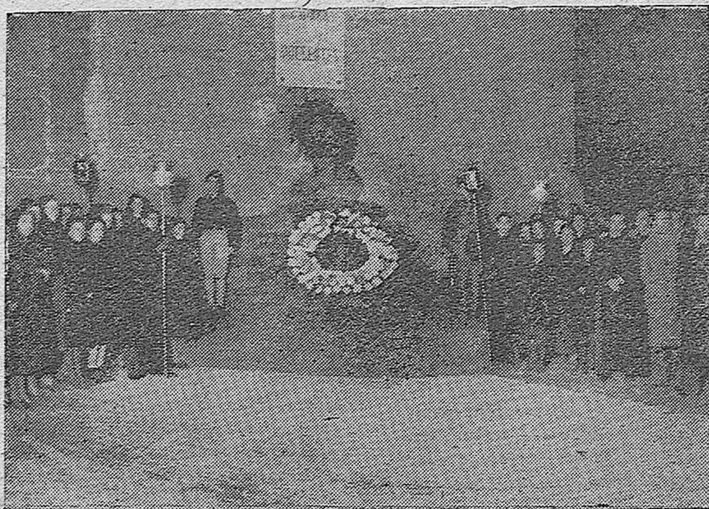
El Rosario de Oración y Penitencia, organizado por la Falange de Córdoba, en el momento de llegar sus primeras filas ante la Cruz de los Caídos, la madrugada del lunes 20 de Noviembre

Frente a la escalinata del quieto mar del puerto se alzaba un murallón de color, cortado como de barras cruzadas, y a su pie, bajo el nombre repetido del caído capitán, la bandera de la centuria que desde el cementerio le trajo en hombros, escoltada por remos y fusiles y alfombrado con redes que sostienen juveniles marinos. Y en la explanada abierta, el Ejército, formado, con el rebrillo de cascos y bayonetas, y en las aguas los barcos de nuestra Armada, y en torno a ellos los veleros arracimados de pe-