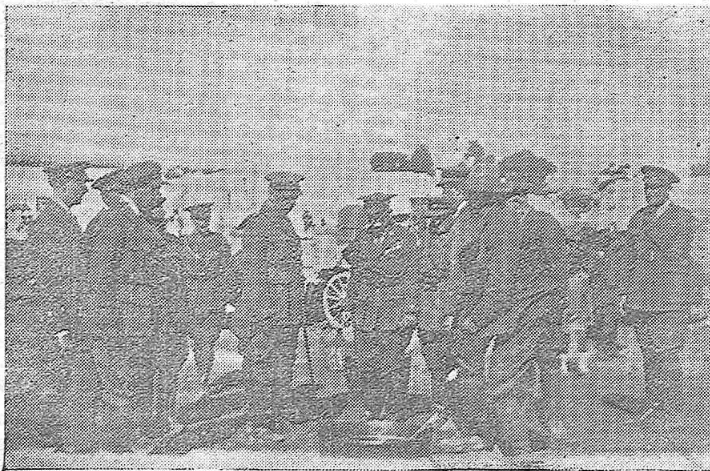
S. A. EL INFANTE DON CARLOS INSPECCIONANDO EL RANCHO DE LA TROPA.