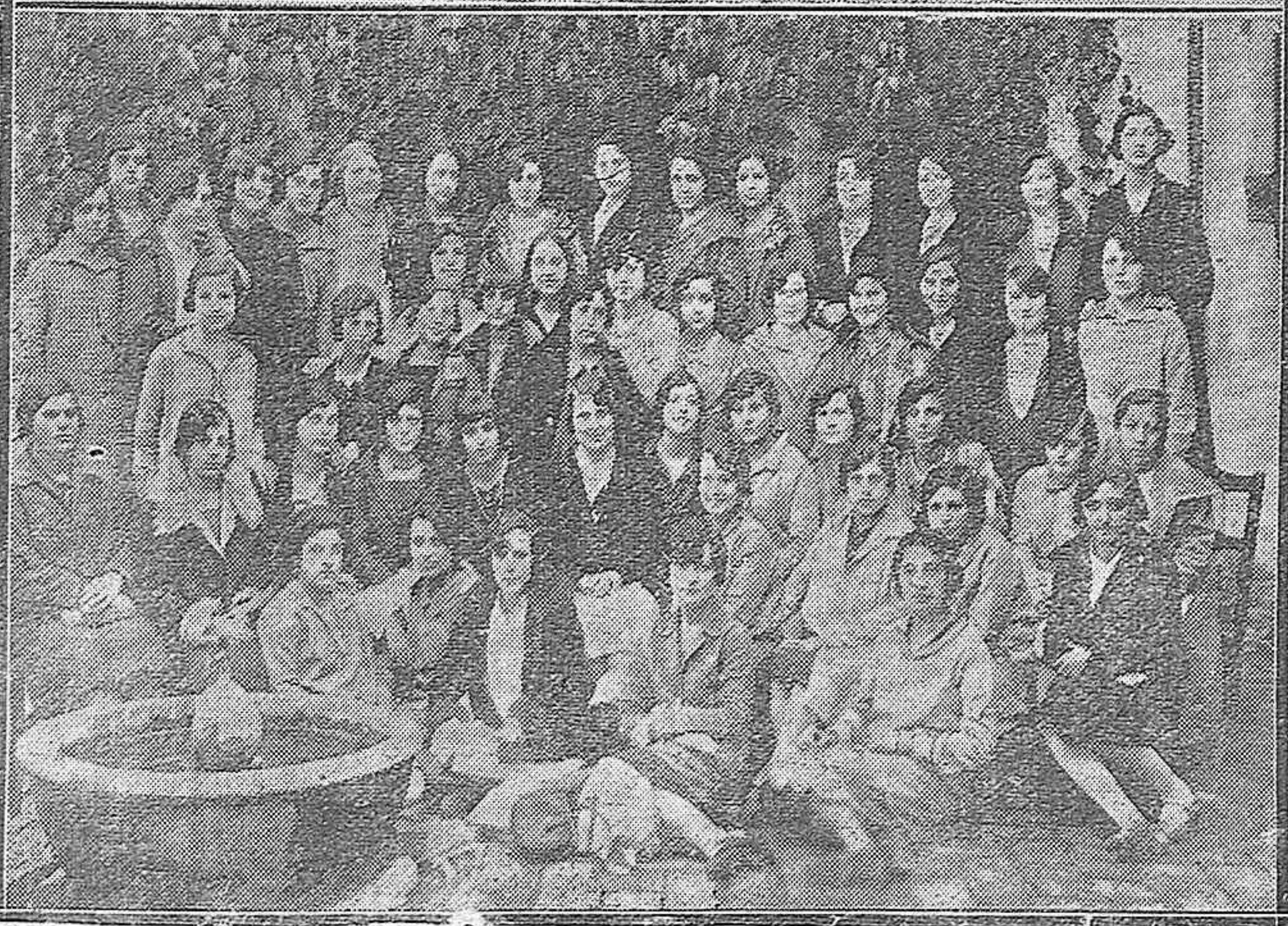
LOS ESTUDIANTES CORDOBESES.—Grupo de bellisimas alumnas normalistas del primero y segundo curso de la carrera del Magisterio.