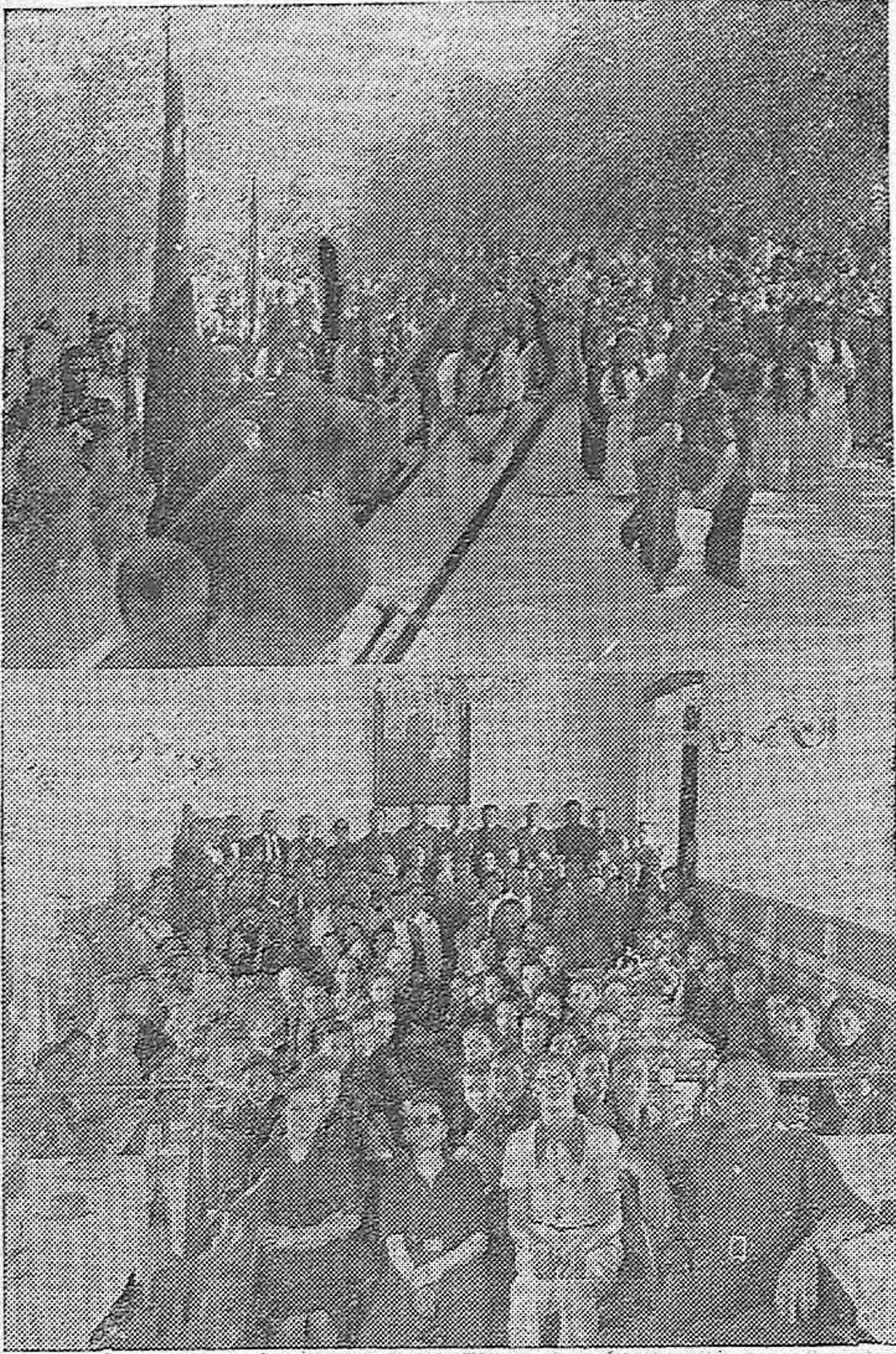
Acto de la Misa de Campaña, en Luce na .—La Comida de Hermandad.

A las nueve y media de la mañana se celebró una Misa de Campaña, en el Paseo de Rojas, lugar apropiado para la Concentración de todas las Organizaciones de Falange, que asistieron en gran número y organización. A ésta, concurren las autoridades, militares y civiles, y una Compañía de Infantería destacada en esta localidad; las Jerarquías del Movimiento asistieron al frente de sus Organizaciones y gran número de público acudió también, resultando el acto solemne y sencillo.