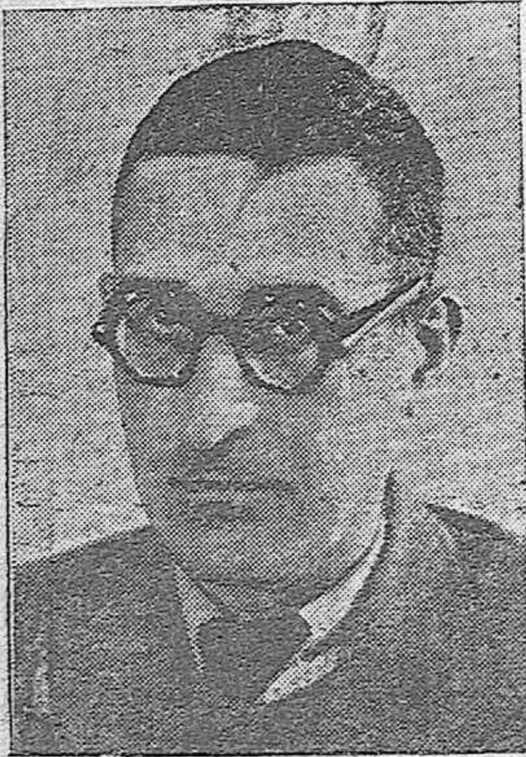
DON RAFAEL SANCHEZ MAZAS, MINISTRO SIN CARTERA

Regresan los combatientes a las aulas para marcar un camino y fijar una conducta. ¡CONTRA LO VIEJO Y AL SERVICIO DE LA REVOLUCION!