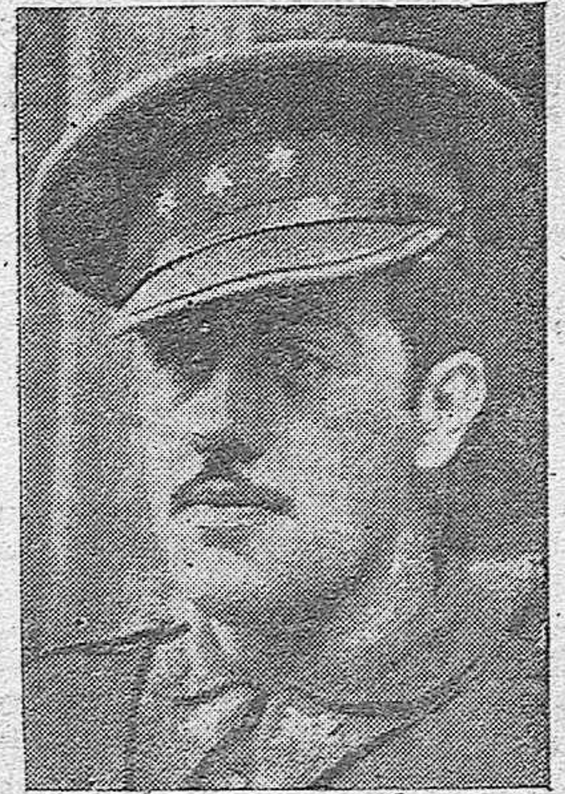
JOSE ANTONIO GIRON, CONSEJERO NACIONAL Y CAPITAN HONORARIO, A QUIEN EL CAUDILLO HA NOMBRADO DELEGADO NACIONAL DE EX-COMBATIENTES