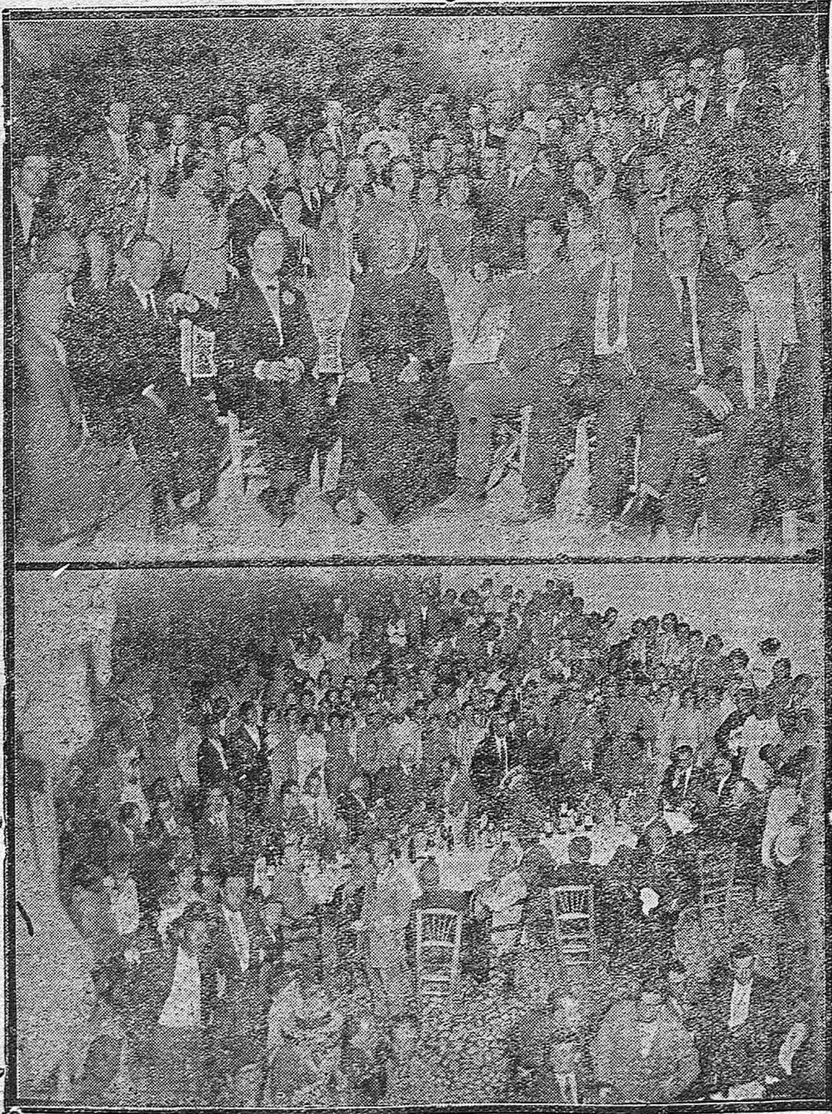
Albendín (Baena).—Banquete popular en honor de las autoridades, con motivo de la traida de aguas e inauguracion de las fuen es públicas.—Mesa presidencial en la plaza del General Primo de Rivera.