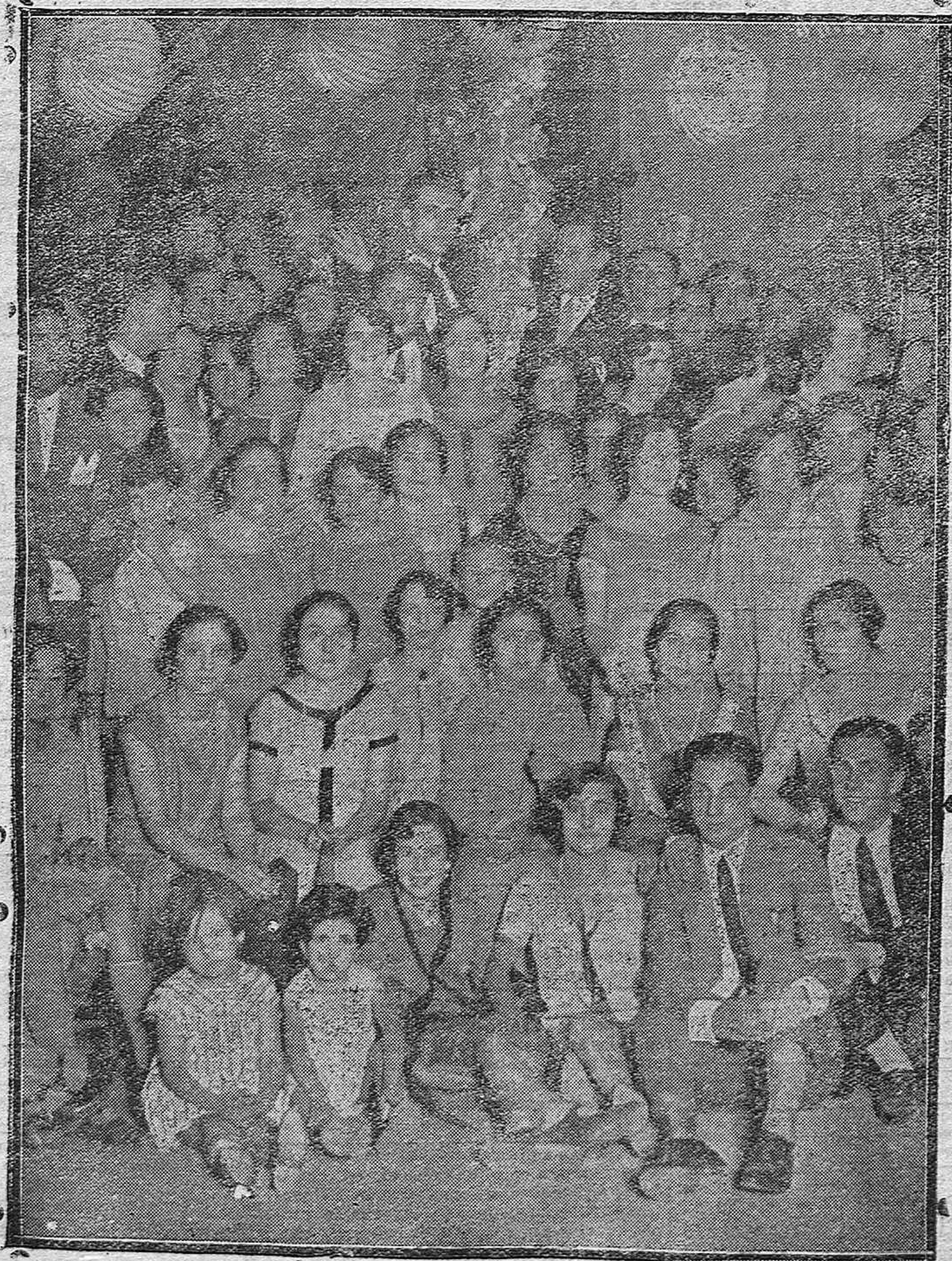
Grupo de concurrentes a la verbena celebrada por la sociedad cultural "Unión Recreativa"