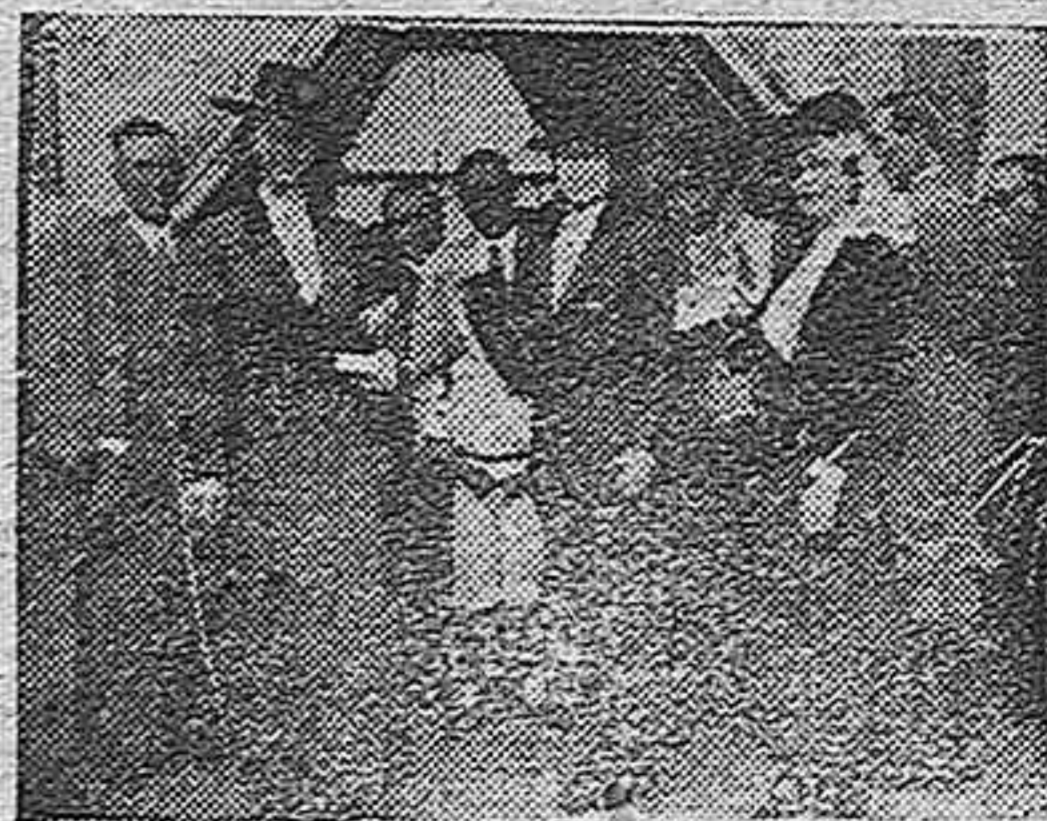
He aquí las bellas señoritas ganadoras del Concurso después de recibir los premios