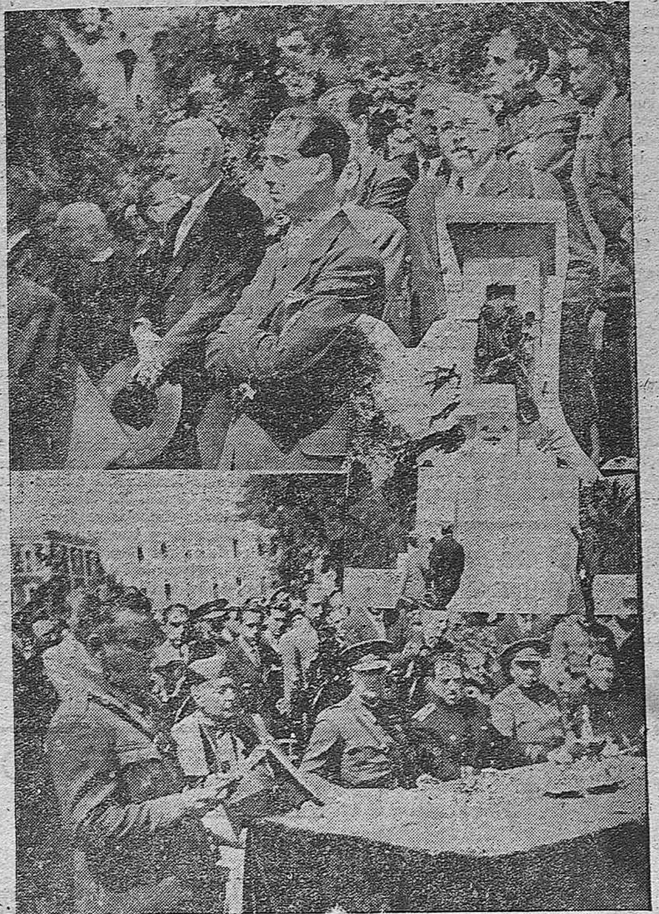
He aquí tres instantáneas del solemneacto.—Entre el público, el hijo del Ilustrado pintor, al lado del famoso torero Rafael Guerra (Guerrita).—El Gobernador civil en el momento de descubrir el monumento.—La presidencia del acto