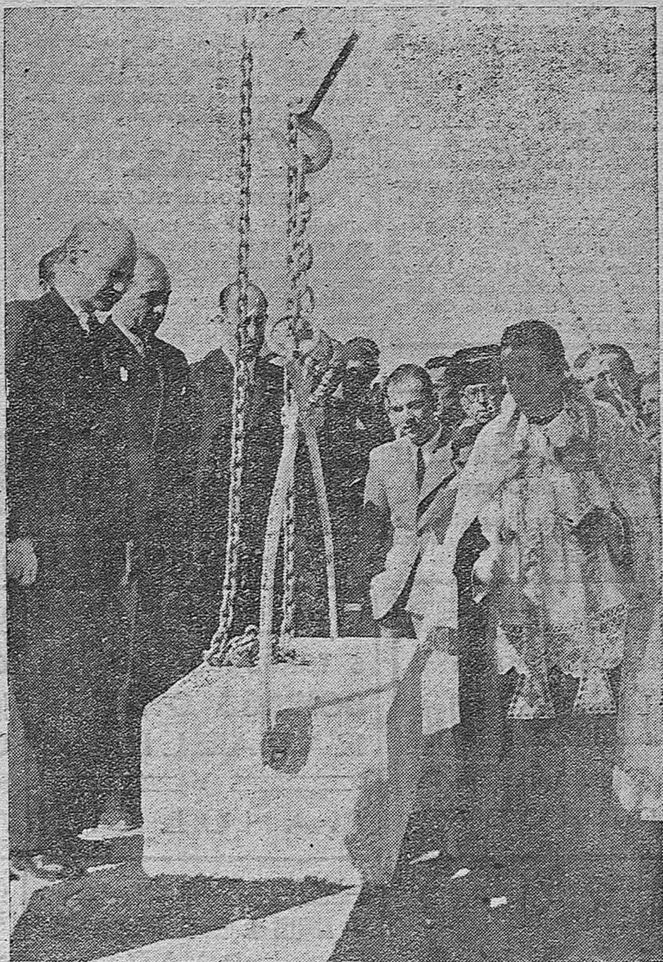
He aquí una fotografía que refleja la preocupación del Nuevo Estado por reconstruir las poblaciones devastadas por la barbarie roja. El ministro de la Gobernación y Presidente de la Junta Política, señor Serrano Suñer, coloca, en Brunete, la primera piedra del grupo de 800 casas para labradores, con lo que se da principio a la reconstrucción de la ciudad

El Excmo. Sr. Jefe de la Casa Civil de Su Excelencia el Jefe del Estado en telegrama de 18 del actual, dirigido al Excmo. Sr. Gobernador Civil de esta Provincia, dice lo siguiente: «Su Excelencia el Jefe del Estado y Generalísimo de los Ejércitos, se ha servido delegar en V. E. su representación para el acto que tendrá lugar en esa ciudad con motivo de la inauguración del Monumento al ilustre artista Romero de Torres. Lo que me complace en comunicarle. Salúdalo afectuosamente.»