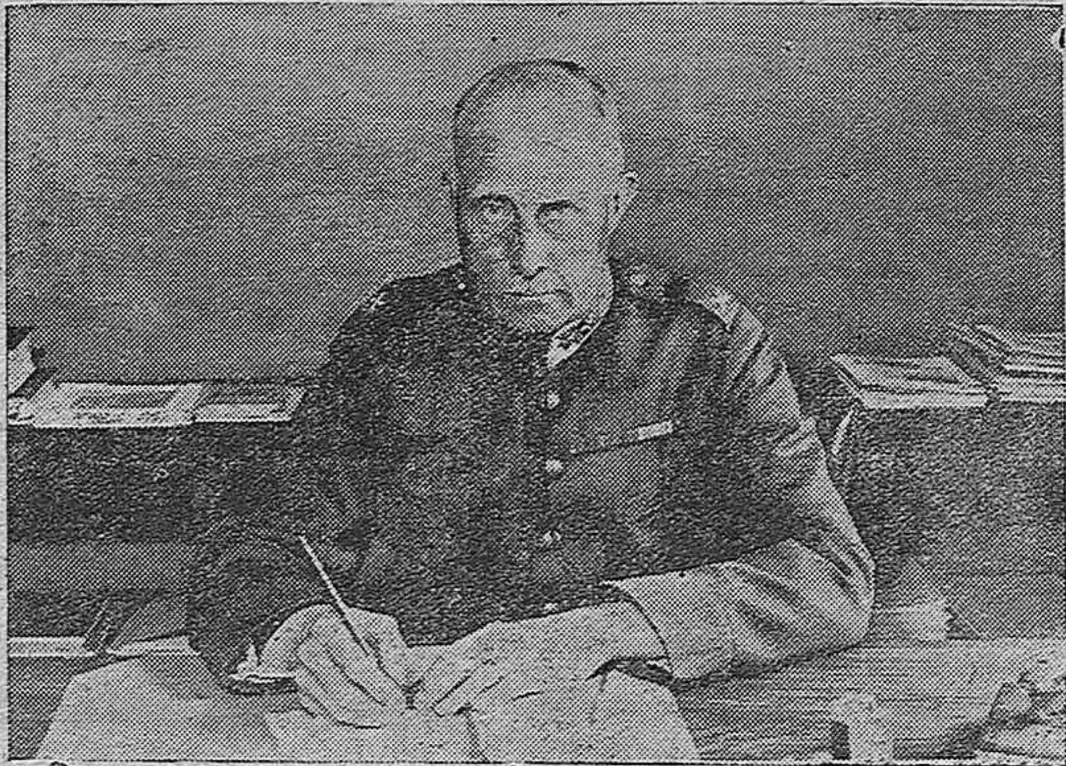
La Ciudad Universitaria va a ser reconstruida. Un aspecto del Hospital Clínico, que ha de conservar sus gloriosas mutilaciones.—El general jefe del Ejército sueco, Thornell.