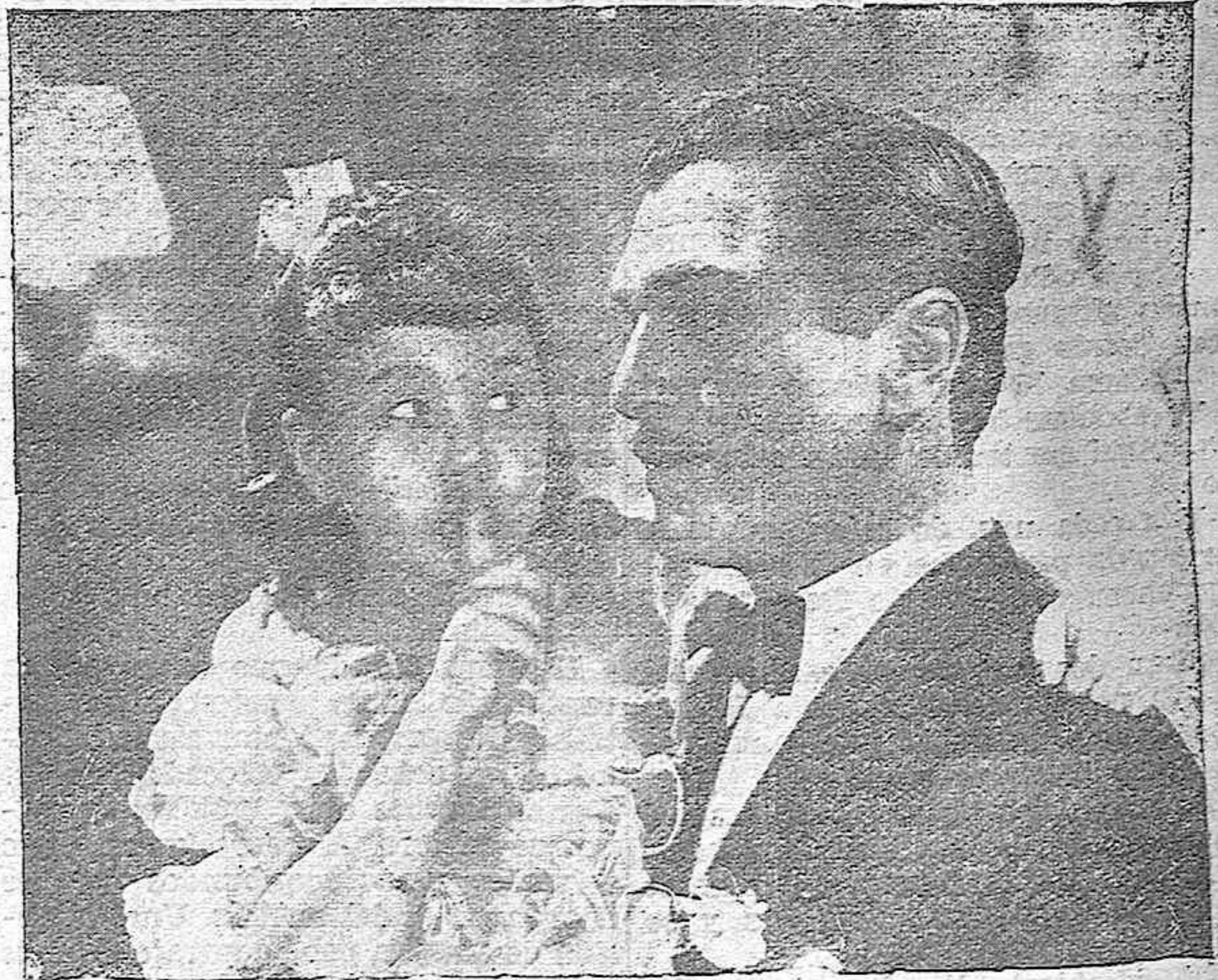
Una graciosa escena de Jane Whiters, estrella de la 20 th. Century-Fox, protagonista de "La reina del barrio", y que próximamente podremos admirar en su mejor creación "La irlandésita"