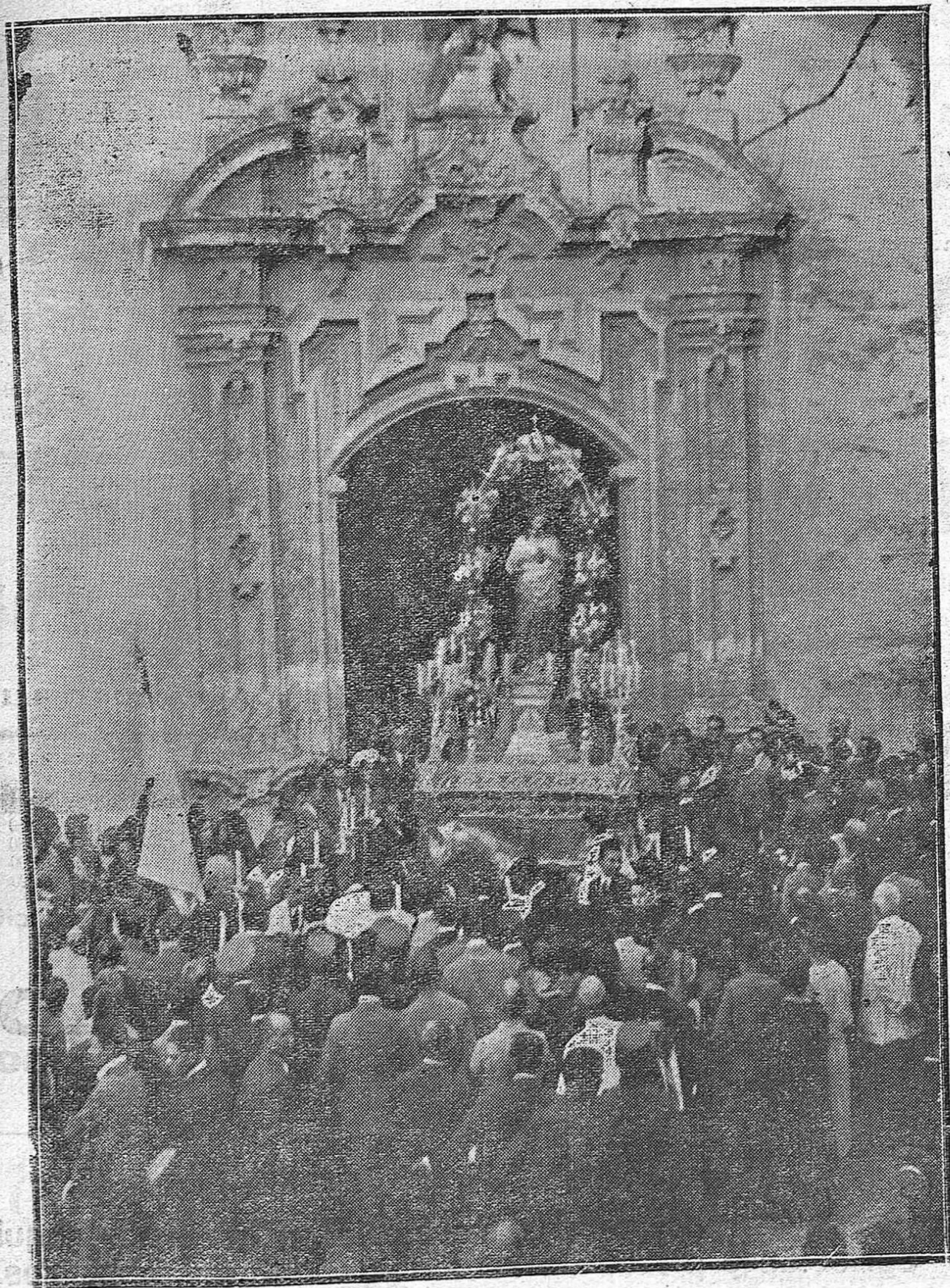
LA PROCESIÓN DE AYER.—LA IMAGEN DEL SAGRADO CORAZÓN DE JESÚS, AL SALIR DE LA REAL COLEGIATA DE SAN HIPÓLITO.