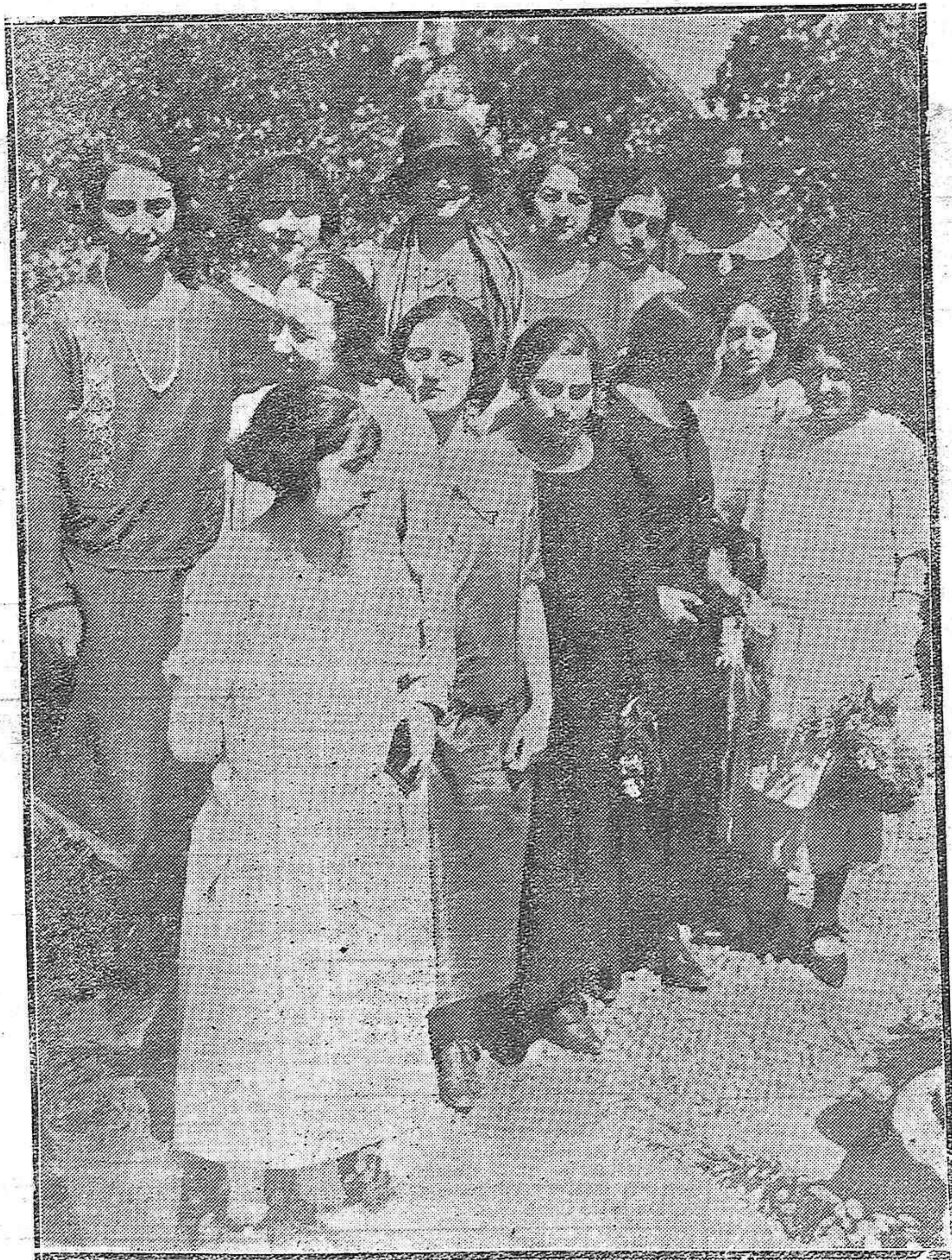
BELLAS JÓVENES ESTUDANTES DEL SEXTO AÑO DEL INSTITUTO ESCUELA DE MADRID, QUE HAN VISITADO NUESTRA CIUDAD EN VIAJE DE PRÁCTICAS.