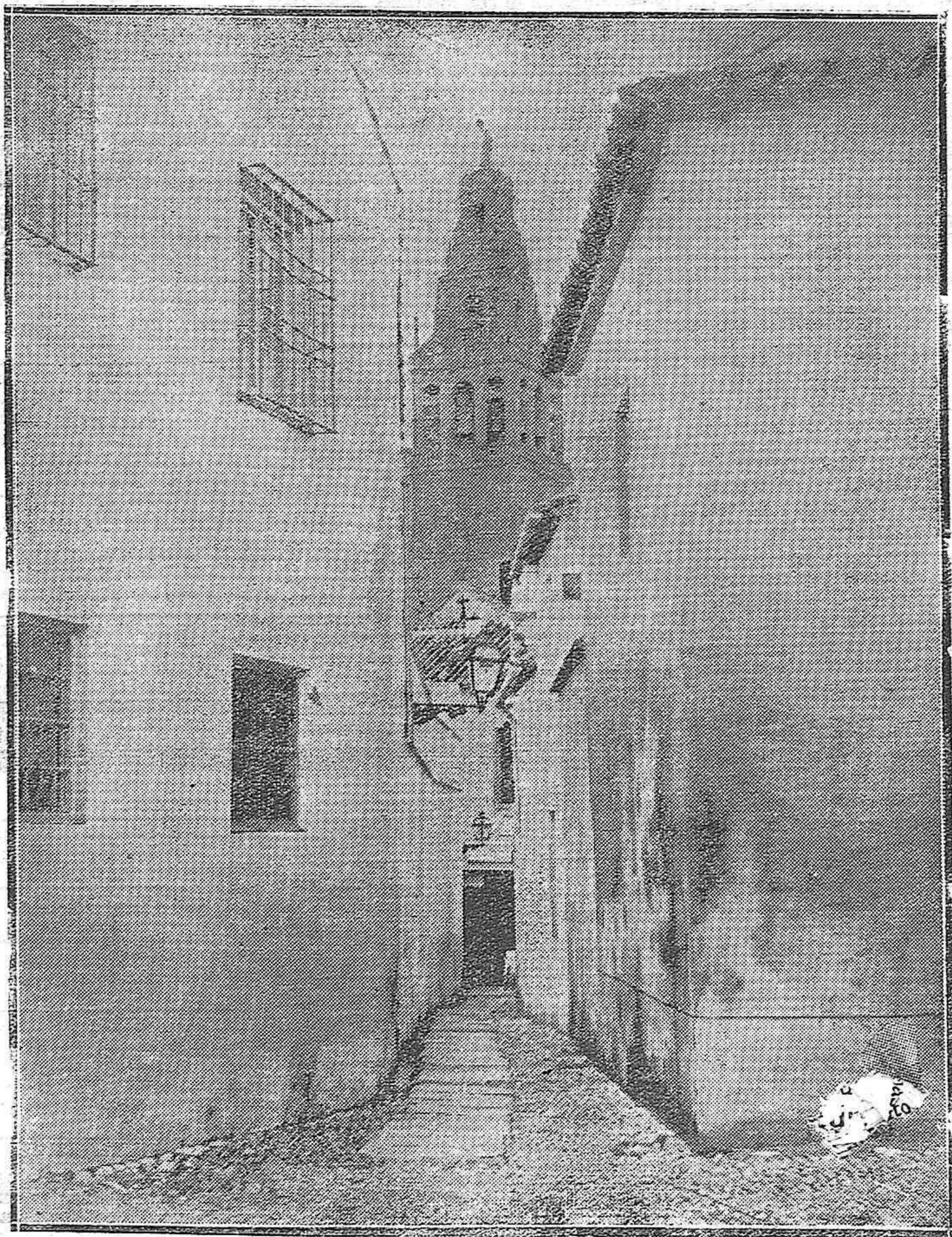
CORDUBA.—LA TORRE DE NUESTRA MEZQUITA. DESDE UN PUNTO DE VISTA SINGULAR.