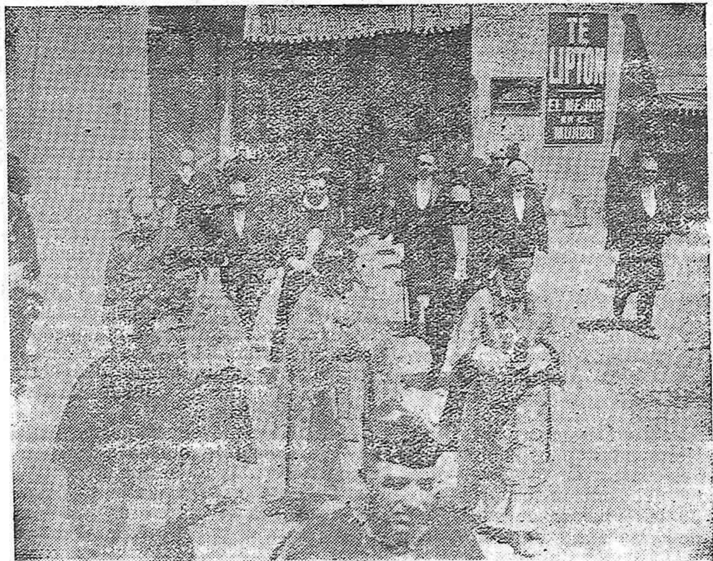
LOS CABILDOS CATEDRAL Y MUNICIPAL EN LA PROCESIÓN CELEBRADA AYER CON MOTIVO DE LA FIESTA A SAN RAFAEL.