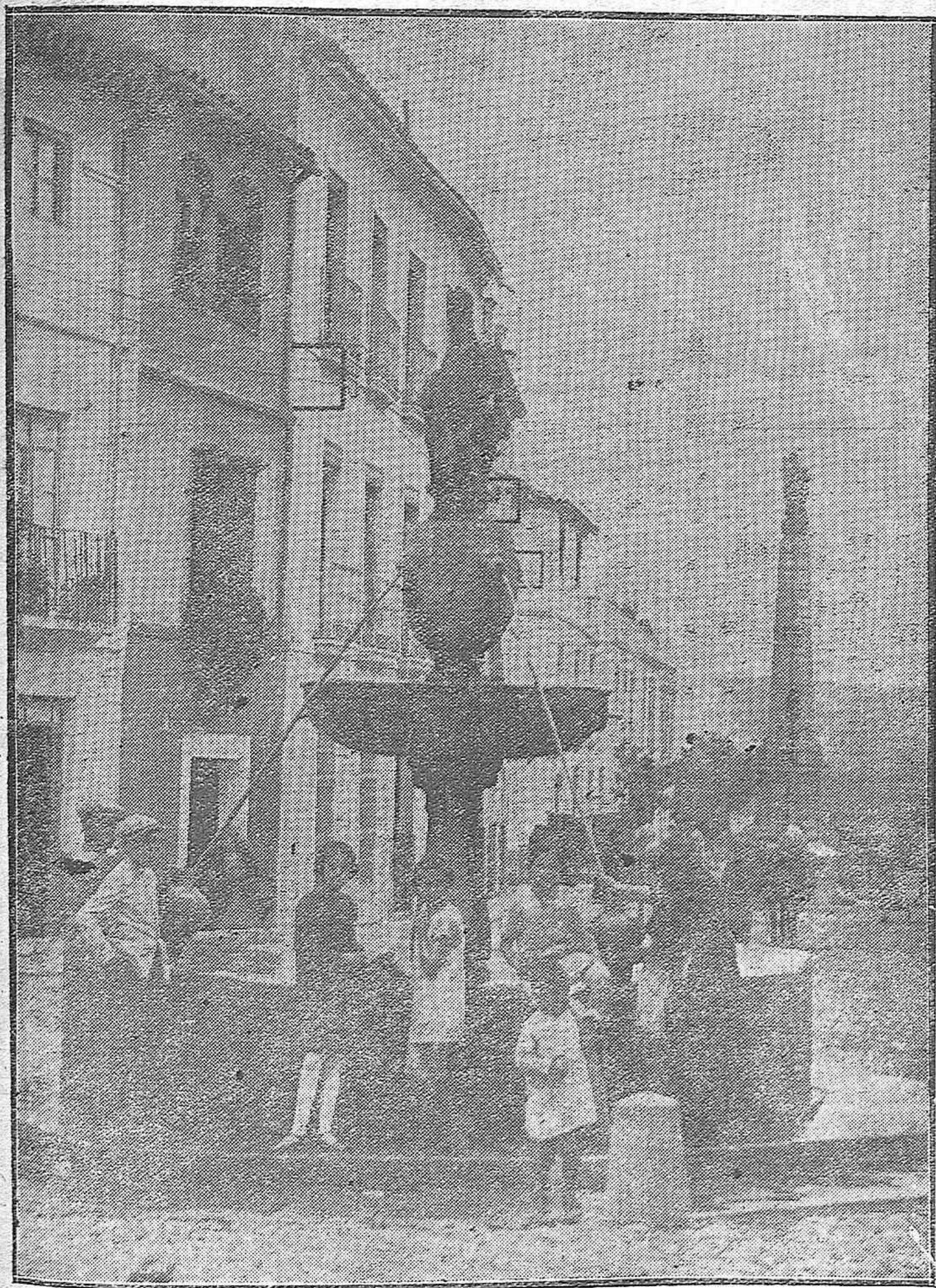
Pintoresco aspecto que ofrece en la actualidad la típica plaza del Póiro, después de su embellecimiento con el monumento al arcángel San Rafael.