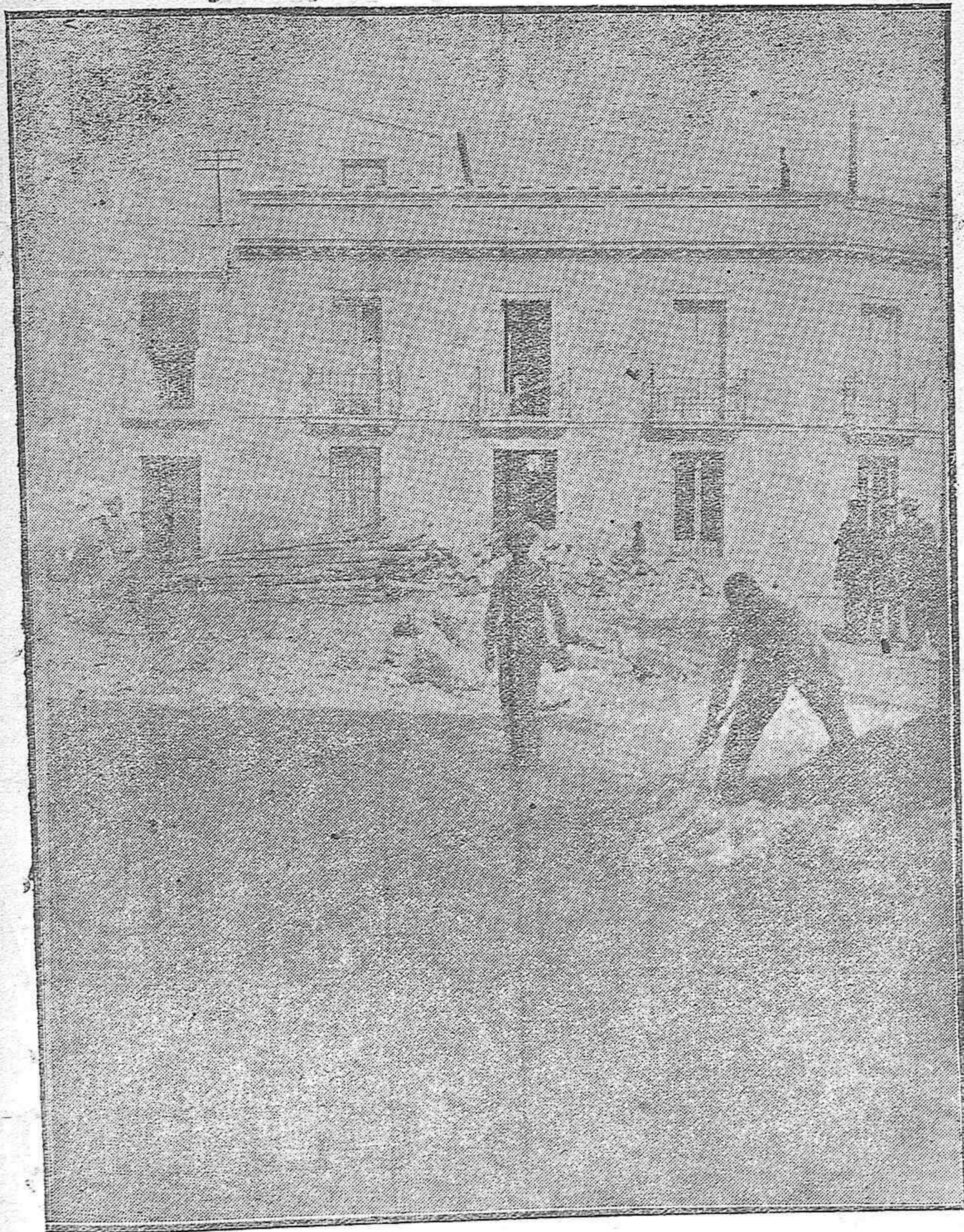
LAS REFORMAS DE CÓRDOBA.--Vista de la nueva plaza resultante del derribo de la manzana de casas comprendidas entre las calles Horno de San Juan y Sevilla.