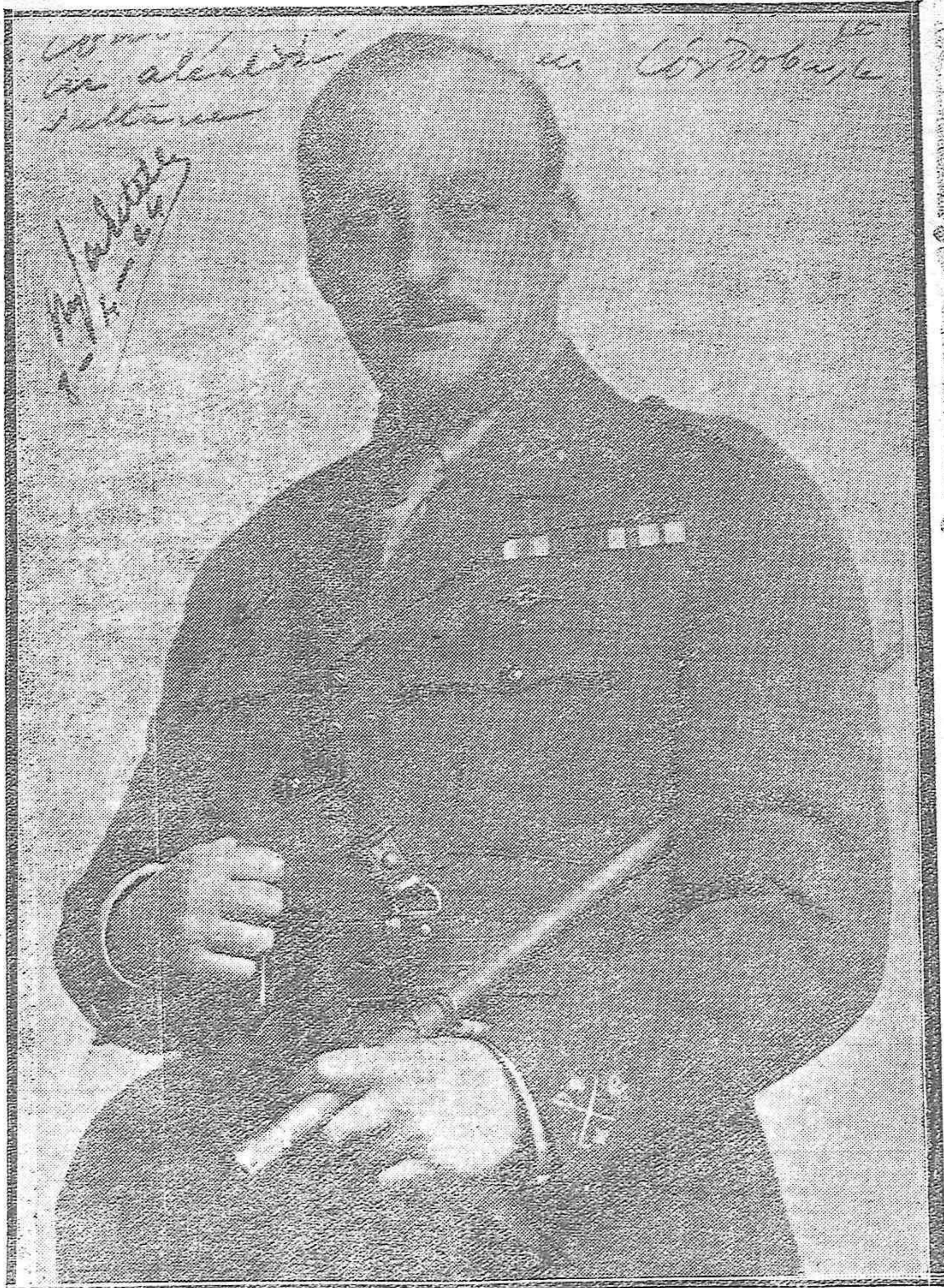
El ilustre caudillo general Primo de Rivera a su paso por Córdoba, donde se le ha tributado un entusiasta homenaje de afecto y admiración