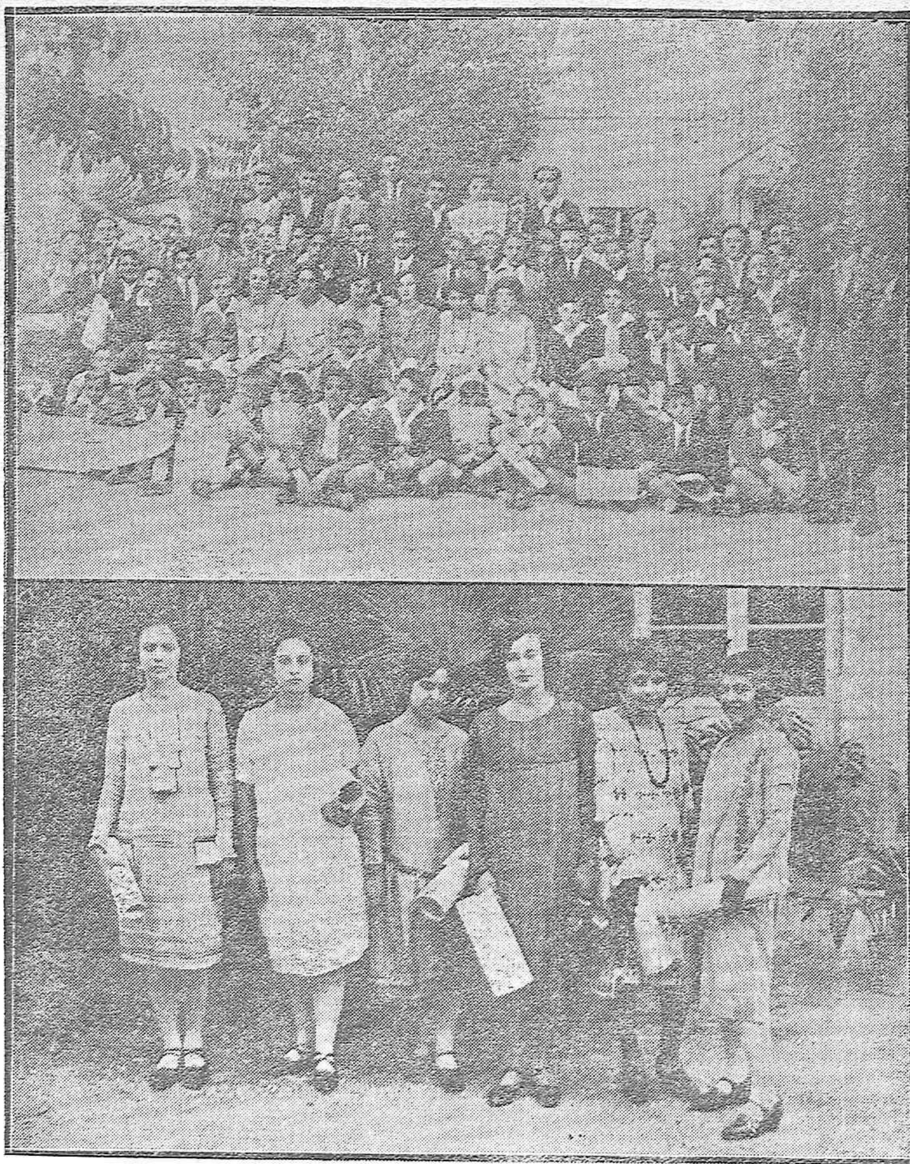
LA APERTURA DE CURSO EN EL INSTITUTO GENERAL Y TECNICO.-1) Grupo general de los alumnos de los distintos cursos que han obtenido premios con Matrículas de Honor.-2) Distinguidas señoras que cursan los estudios del bachillerato con extraordinaria brillantez.