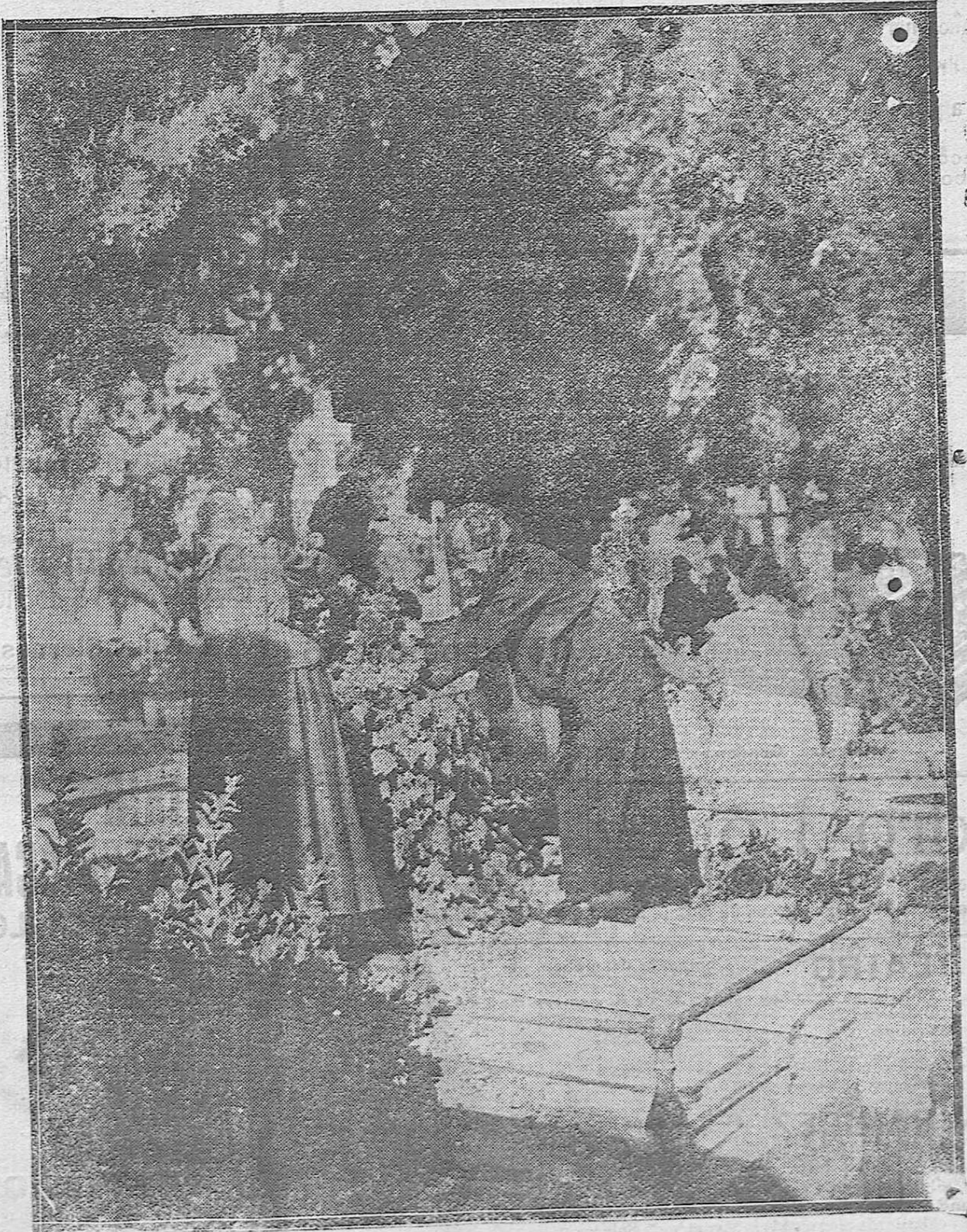
EN RECUERDO DE LOS QUE FUERON.—INTERESANTE FOTOGRAFIA OBTENIDA EN EL CEMENTERIO DE LA SALGA EN LA MAÑANA DE AYER.