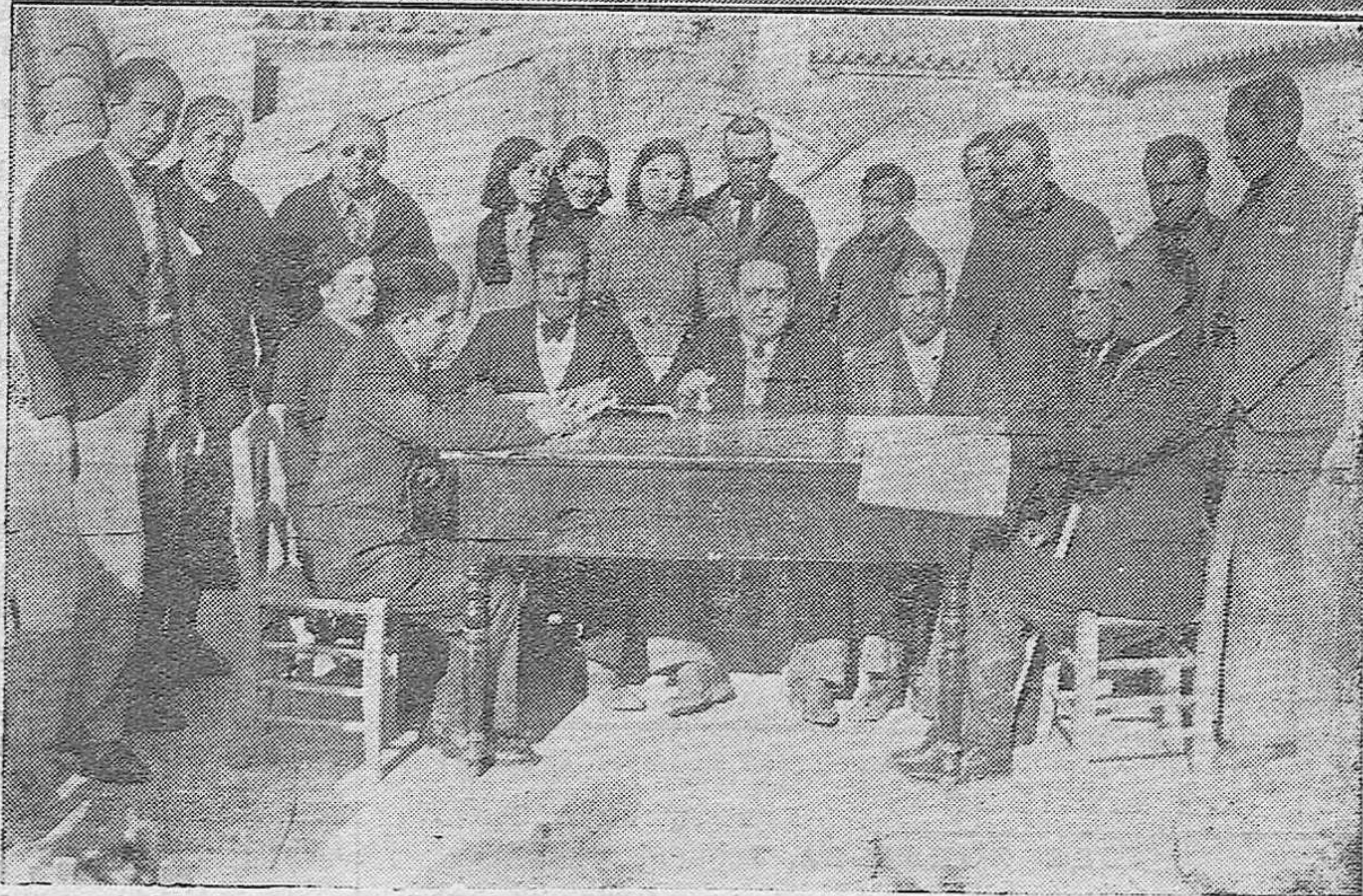
Dos detalles de la Asamblea de Ciegos celebrada en el local de su Asociación Provincial. Concurrieron al acto varios delegados, acordando solicitar ayuda de los videntes para los fines benéficos de la Agrupación.